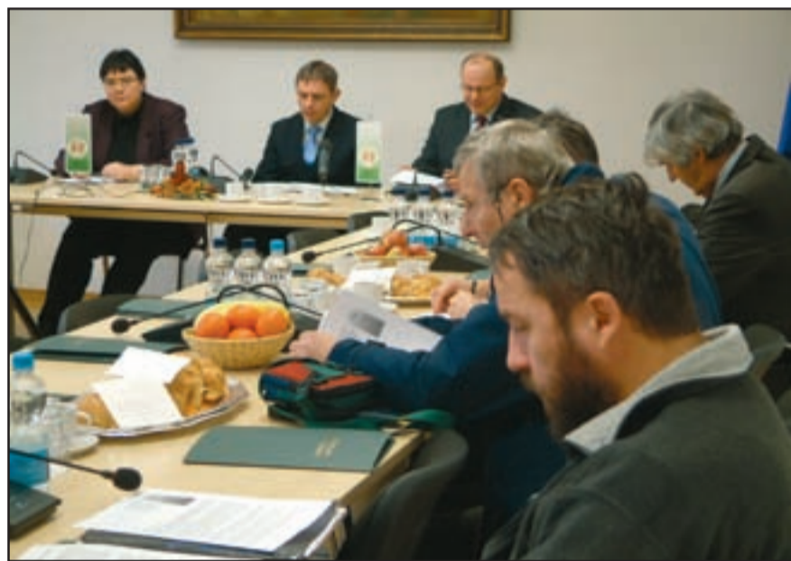
Zadružna zveza Slovenije novinarjem predstavila svoje delo