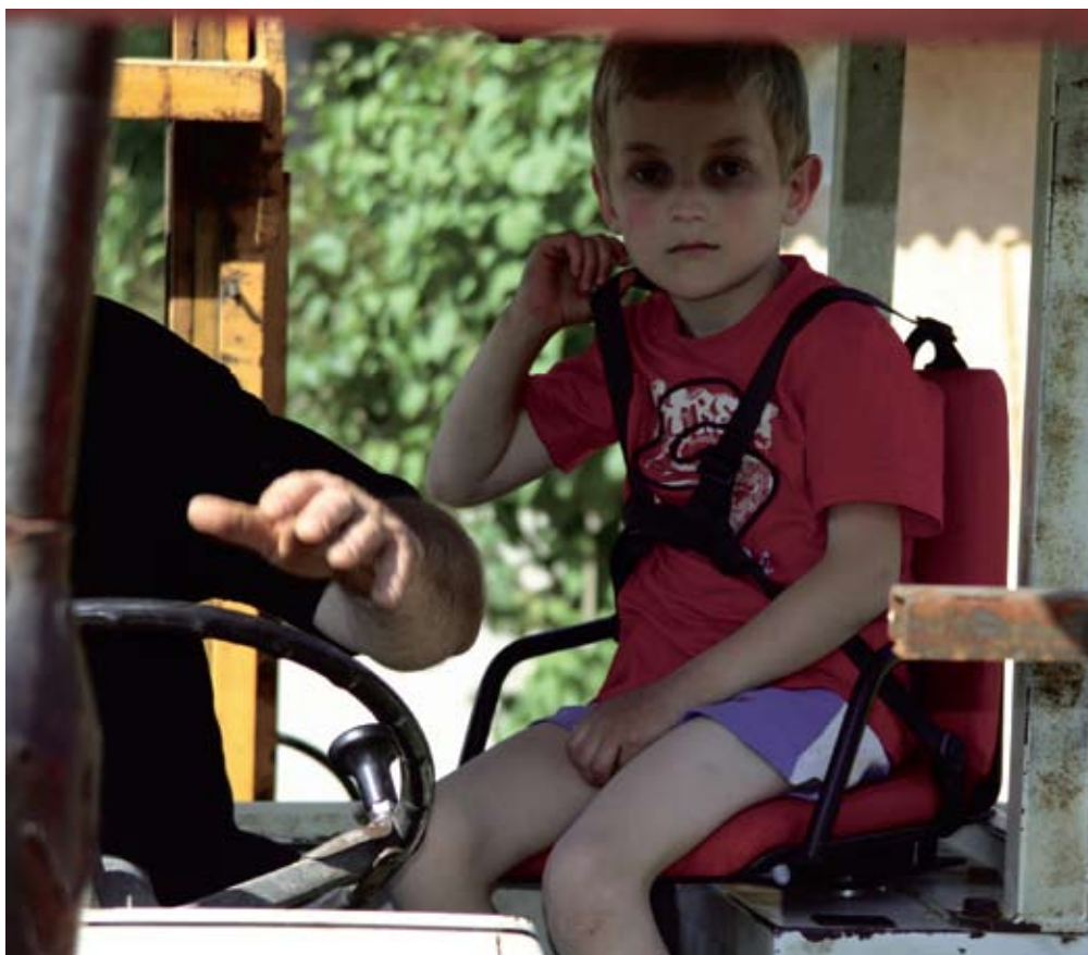
otroci sem smejo na traktorju voziti le na ustreznem sedežu z vgrajenimi zadrževalnimi sistemi, primernimi njihovi velikosti. Priporočamo, da je tak sedež vzmeten.

Med preventivnimi ukrepi je nedvomno na prvem mestu spodbujanje zavedanja nevarnosti oz. dvig »kulture varnosti«. Med represivnimi ukrepi je potrebno upoštevati veljavno zakonodajo in to s pravo mero, a dosledno. Potrebno je razre-