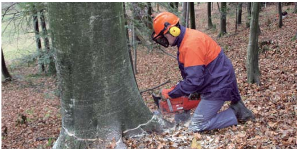
Predpogoj za varno delo v gozdu sta usposobljenost in ustrezna osebna varovalna oprema.

»Meni se kaj takega ne more zgoditi,« pogosto slišimo, ko med kmeti nanese pogovor na še eno od nesreč, v kateri je družina ostala brez sina, očeta ali starega očeta, kmetija pa brez gospodarja. Tragedija je trenutno aktualna, morda še, dokler ne ovne cvetje na svežem grobu, potem pa v hitenju vsakdana nanjo, razen domačih, hitro pozabimo. Pa tudi če ta misel že ni izrečena na glas, je pogosto, prepogosto, trdno zasidrana v mišljenju naših kmetov. Tako trdno, da se ne zavedajo/mo, da je to že prvi korak, da se lahko kateremu koli izmed njih in nas zgodi prav to. Morda že danes, jutri. In da bi to preprečili, naredimo malo, in v preštevilnih primerih se gibljemo na tanki meji med »biti« in potencialno jutri že »ne biti«. Kako racionalno razložiti preštevilne primere, ko na kmetiji zmorejo več deset tisoč evrov za nov traktor, »zmanjka« pa kakih 300 evrov, da bi na stari traktor namestili lok. Kot da je »ceneje«, če se z njim ubije stari oče, ko v sezoni s »ta starim« traktorjem pomaga zgrabljati krmo! In delež mrtvih kmetov upokojencev je vsako leto večji. In ne boste verjeli: v Sloveniji je kar okoli 30.000 traktorjev neregistriranih in le-ti so večinoma brez loka in kabine in z njimi se kmetje vztrajno pobijajo. In tudi pri delu v gozdu vsako leto vztrajno plačujemo visok krvni davek. In kje je čarobna palica, ki bi presekal ta gordijski voz? Ima jo vsak izmed nas, zase in za svojo okolico.