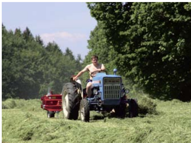
Okoli 30.000 traktorjev v Sloveniji nima loka ali kabine in pri prevrnitvi za voznika praviloma ni rešitve.

samouničevalno. Ljudje se sploh ne zavedajo nevarnosti, ki nanje prežijo pri tem delu, kot da bi v naprej klicali nesrečo. Vzamejo motoriko v roke in odidejo v gozd, češ, meni se ne more nič zgoditi. In na terenu bi težje našli kmeta, ki bi se v gozd odpravil v varovalnih gozdarskih hlačah, varnostni obutvi, z gozdarsko čelado s ščitnikom za obraz in glušniki ter rokavicami, kot pa takega, ki se na vse to poživizga. Spomnimo, da je pri nas kar 300.000 lastnikov gozdov in marsikdo še vedno ne more razumeti, da bi bilo ceneje, predvsem pa veliko varneje, če bi za posek, ki se ga sicer amatersko loti vsakih nekaj let, najel izvajalca gozdarskih storitev,