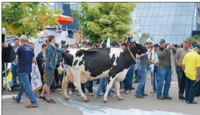
Mlečni protesti se to poletje po Evropi kar vrstijo. Na zadnjih protestih v Belgiji so kmetje na polja v okolici kraja Ciney v znak protesta zlili kar tri milijone litrov mleka.

Zaradi drastičnih razmer, s katerimi se soočajo evropski rejci mlečnih govedi, COPA in COGECA pozivata kmetijske ministre članic EU, da se dogovorijo o nujnih ukrepih za pomoč pri izboljšanju težkega položaja na trgu in preprečitev skrajnega ukrepa prenehanja mlečne proizvodnje.