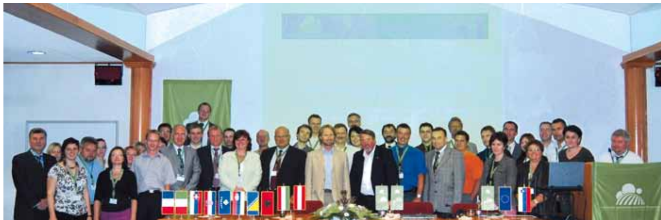
KGZS je v času sejma organizirala Mednarodno konferenco kmetijskih nevladnih organizacij EU in Zahodnega Balkana. Udeležilo se je osemnajst delegacij iz enajstih držav.

organizirala Mednarodno konferenco kmetijskih nevladnih organizacij EU in Zahodnega Balkana . Na konferenci so sodelovali predstavniki iz enajstih držav s kar osemnajstimi delegacijami. Dogodka so se udeležili številni predstavniki slovenskih kmetijskih nevladnih organizacij. Vabilu so se odzvali v večjem številu tudi zamejski Slovenci, s katerimi zbornica sodeluje.