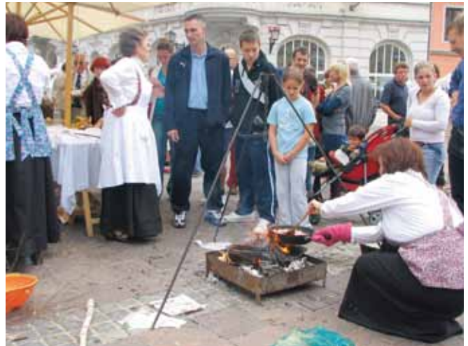
Poleg bogatega kulturnega programa so bili obiskovalci deležni tudi degustacij mnogih domačih dobrot.

Podeželje v mestu vedno obudi tudi tradicionalne šege slovenskega podeželja. Tokrat