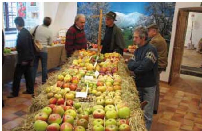
Predstavitev starih sort, ki so jih večinoma prispevali člani Sadjarskega društva Cerkno, Idrija.

V okviru razstave je bila posebna pozornost namenjena osnov-