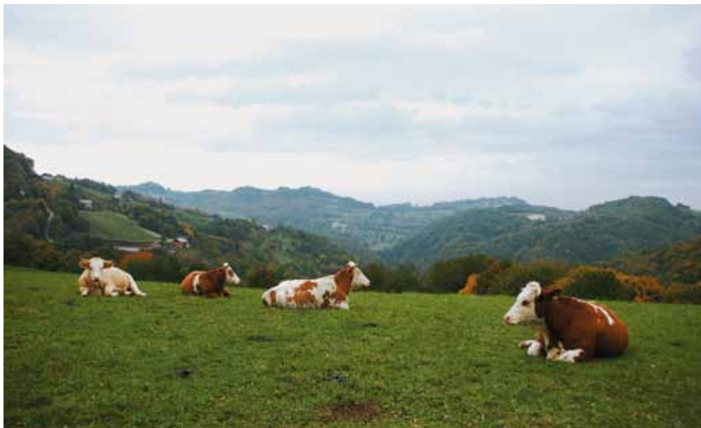
Letos sta v veljavi dva nova ukrepa za spodbujanje živinoreje: dodatno plačilo za mleko za gorsko-višinska in strma območja in podpora za ohranitev živinoreje na kmetijskih gospodarstvih s travinjem.

Višina plačila za tono mleka se bo izračunala tako, da se bo skupna višina sredstev, namenjenih za ta ukrep, delila s skupno mlečno kvoto iz oddanih zahtevkov. Posamezniku pa se izplača tako, da se znesek, izračunan za tono mleka, pomnoži