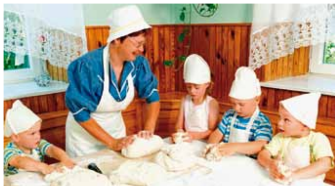
Na kmetiji Primož pri Laškem so otroci zamesili in spekli svoj prvi kruhek.

V okviru projekta so potekala tudi usposabljanja za ponudnike. Spoznali so učne vsebine za vrtec in osnovne šole in pogoje za zagotavljanje varnosti otrok in gostov na kmetiji ter se usposobili za delo s predšolskimi in osnovnošolskimi otroci v naravi in sprejem obiskovalcev na svoji kmetiji. Primere dobre prakse so si ogledali na Koroškem, kjer so jih navdušili Škratova dežela ter kmetiji Polh in Klančnik, svojo bodočo dejavnost pa so dvakrat predstavili tudi na prireditvi Podeželje v mestu v Celju. Pri vseh ponudnikih je bilo izvedeno fotografiranje in nastalo je veliko kakovostnih fotografij za promocijske namene. V oktobru so bili na območju vseh štirih občin uspešno izvedeni prvi obiski šolarjev in otrok iz vrtcev. Vtisi s teh ogledov