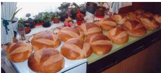
Iz 15 kilogramov moke speče Ema 22 kilogramov dišečega kruha.

Pri nas enkrat na mesec še pečemo kruh doma, pri tem delu seveda vedno pomagam ženi. Za eno peko pripraviva 15 kg moke tipa 500. Moka mora biti tako suha, da se pokadi, ko jo stresemo v za to pripravljeno posodo. Za toliko moke je treba 2 litra posnetega mleka, 15 dag soli, 1 dcl olja in 5 kock kvasa, mlačno vodo dodajamo po potrebi. Testo gnetemo toliko časa, da se ne prijemlje posode in rok. Testo pokrijemo in ga pustimo toliko časa, da pripravimo peč.