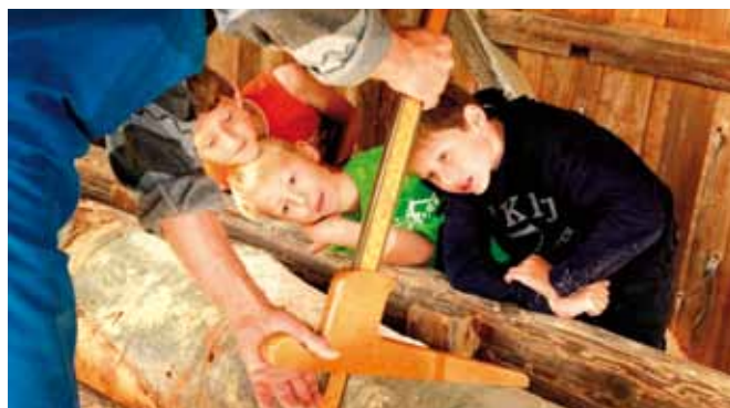
Delo na žagi „venecijanki“ je pritegnilo pozornost otrok (Soržev mlin pri Vojniku).

so predstavljeni na zadnjih straneh novega kataloga.