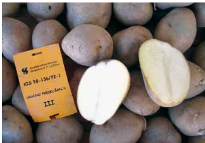
Sorta kokra je srednje zgodnja sorta.