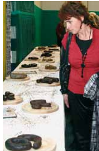
Prva čurkarijada na Kogu je morda začetek tradicionalne januarske prireditve, katere namen je ohranjanje kulinarične dediščine.

Prva čurkarijada na Kogu je na eni strani obudila spomin na kulinarično dediščino podeželja in organizatorjem Antonovanja na Kogu dala dobro vsebino, ki se lahko tradicionalno odvija ob tem prazniku vsako leto v januarju. Sodelujočim kmetijam v ocenjevanju čurk pa je morda nakazala tudi možnost trženja teh izdelkov v okviru dopolnilnih dejavnosti na kmetijah. Kakovost izdelkov na prvem ocenjevanju je lahko izziv za izdelavo teh izdelkov na posameznih