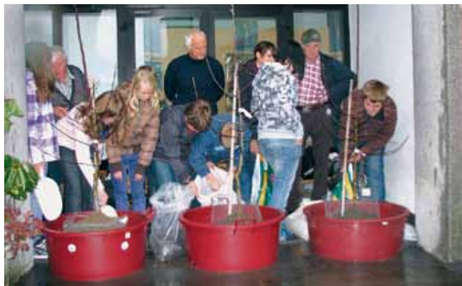
Prikaz sajenja sadik jablan.

nošolcem, ki so jo prva dva dneva množično obiskovali. Kmetijska svetovalna služba pri Kmetijsko gozdarskem zavodu Nova Gorica je za njih pripravila predstavitvi Spoznajmo sadovnjak in Sadje in zdravje ter zagotovila vodenje po