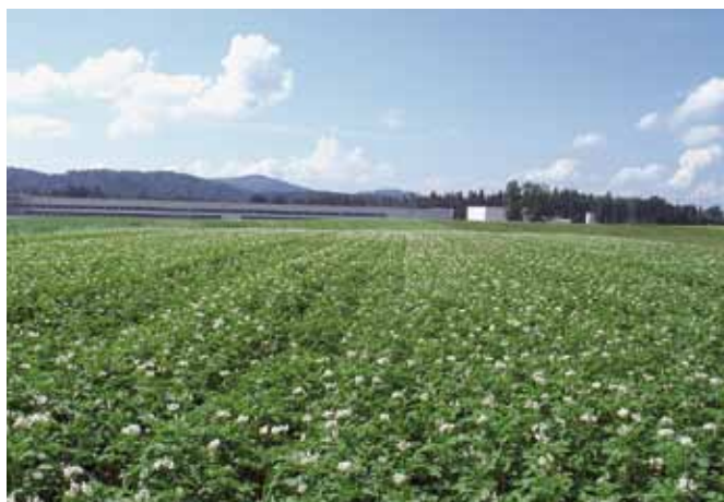
Polje krompirja sorte bistra

V Sloveniji je ena glavnih in pogosta težava tudi pomanjkanje ustreznih ekološko pridelanih semen. Še tista, ki so na voljo, so pogosto pridelana v drugih državah. Te težave smo se na Kmetijskem inštitutu Slovenije zavedeli že pred leti tudi pri krompirju. V okviru programa žlahtnjenja krompirja smo pričeli z vzgojo primernih domačih sort, v letošnjem letu pa tudi že ekološkega semena.