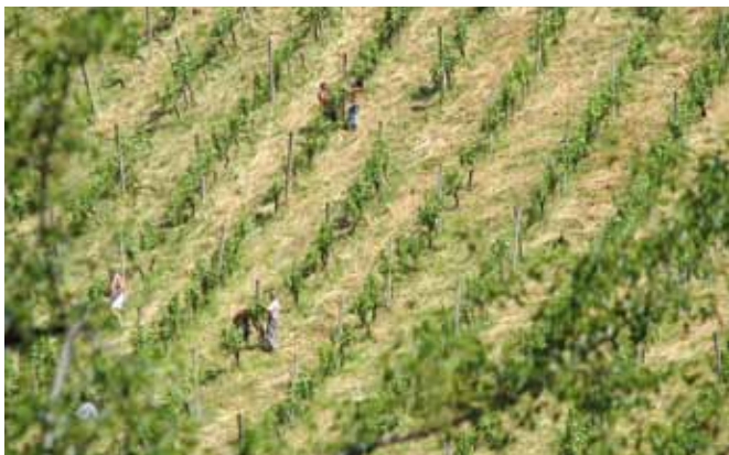
Za vinograde z nagibom 30 do 40 % bo po novem možno pridobiti dodatna plačila, vendar pod določenimi pogoji.

Če je v postopku uskladitve GERK-ov z evidenco dejanske rabe zaradi odprave mostičkov med dvema površinama z isto vrsto dejanske rabe prišlo do zmanjšanja površine, na kateri se izvajajo podukrepi KOP-a, se to zmanjšanje ne upošteva kot zmanjšanje prevzete obveznosti in se ne všteva v dovoljen 10-odstotni obseg zmanjšanja vstopne površine. Na površinah, ki ne izpolnjujejo več pogojev glede velikosti, upravičene do plačila, obveznost izvajanja podukrepov KOP-a preneha, kar pa ne velja za podukrepe integrirane pridelave.