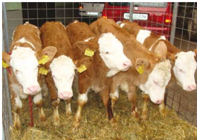
Slika 2: Potomci načrtnega parjenja krave Liske, ki so se rodili v februarju 2011 kot rezultat transplantacije zarodkov v druge krave.

Potomke bikov, ki bodo imeli plemensko vrednost večji od 100, bodo glede na pričakovano