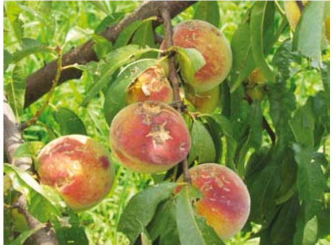
Neurje s točo je poškodovalo več kot 100 hektarjev nasadov breskev, ponekod je škoda stoodstotna.