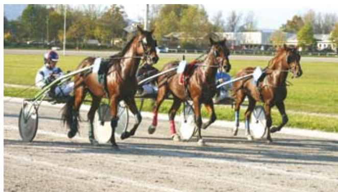
Kasači sodijo med športne pasme konj.

Rejski programi s področja konjereje so bili v preteklosti in so še v preveliki meri naravnani predvsem v definicije takih rejskih nalog, ki so bile pod pojmom stroka pisane na kožo inštitucijam. Tak pristop se v preteklih desetletjih ni izkazal za učinkovitega, saj smo kljub ve-