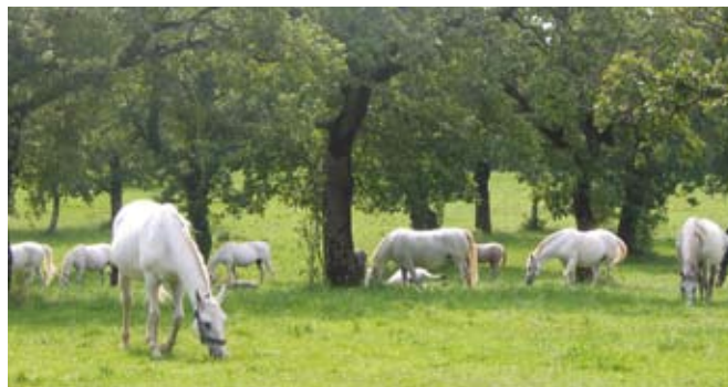
Lipicanci imajo poseben položaj med ostalimi pasmami konj.

pri večini avtohtonih in tradicionalnih pasem pridelali precejšen rejski zaostanek. To dokazuje dejstvo, da gre v redkih primerih izvoza predvsem za klavne konje, zanimanje za slovenski plemenski material pa je zanemarljivo. Povezovanje rejcev na pasemskih osnovah, v obliki PRO, ki ga je zahtevala harmonizirana evropska zakonodaja pred sedmimi leti, je prvič povezal rejce na rejski osnovi in je prinesel tektonske premike v miselnosti rejcev. Znotraj tega organizacijskega okvira smo se rejci prvič začeli pogovarjati o kakovosti in rejskih ciljih slovenskih populacij konj, kar je velik pozitiven premik v pravo smer. Žal pa primerjava s PRO v konjerejsko razvitejših državah s stoletno tradicijo pokaže, da so teoretično uzakonjene pristojnosti PRO v Sloveniji v praksi močno omejene s šibko tradicijo rejske kulture pri nas rejcih samih in bolj ali manj prikritim odporom inštitucij, ki so še do nedavnega edine krojile rejsko politiko. Čeprav je v PRO še vedno prisotna pripravljenost na prostovoljno delo, pa zagnanost upada. Država je PRO po evropski direktivi morala umestiti v svoj pravni sistem, ni pa zagotovila izvedbenih pogojev za njihovo delovanje. Namesto da bi popravila zgodovinsko kri-