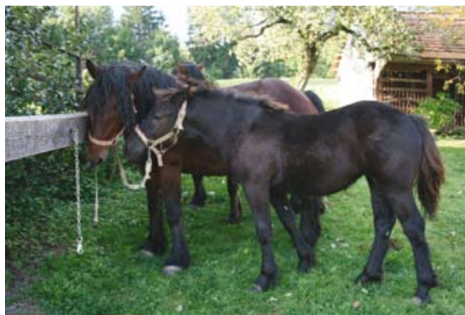
Slovenska hladnokrvna pasma

krajine. Vedno več je tudi specializiranih konjerejskih kmetij z več kot desetimi kobilami. Reja konj ugodno vpliva na vzgojo mladine, vzpodbuja dopolnilne dejavnosti, dodatna delovna mesta in koristno ter zdravju prijazno izrabo prostega časa.