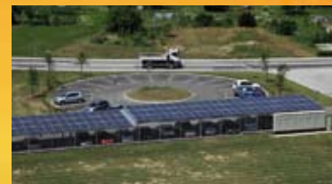
Brestanica 82 - kWp