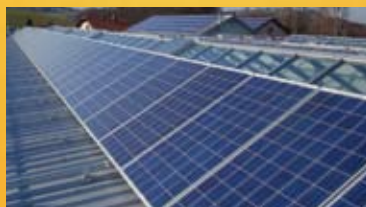
Šmarje pri Jelšah - 243 kWp

Dobavo različnih komponent za sončne elektrarne (moduli, razsmerniki, podkonstrukcija, komunikacijska in merilna oprema, ...).