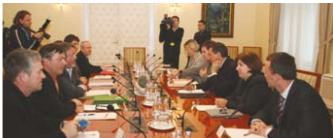
Predstavniki nevladnih kmetijskih organizacij pri predsedniku Vlade.

Predstavniki nevladnih kmetijskih organizacij so ponovno opozorili na nepravilna razmerja znotraj verige »od kmeta do kupca«. Minister Židan se je strinjal, da ne morejo podpirati netransparentnosti znotraj verige. Pravičnejša razmerja bi se lahko uredila tudi s posebnim kodeksom, ki pa bi moral biti po mnenju ministra obvezujoč in nadzorovan. Ciril Smrkolj je pou-