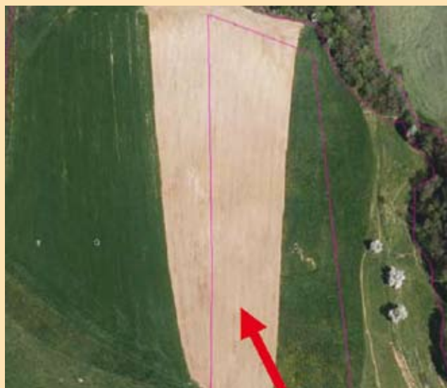
Nepravilno vrisan GERK (meje njive so nepravilno vrisane)

Ali smo na površinah, na katerih smo spremenili dejansko rabo, to stanje spremenili tudi v GERK-ih?