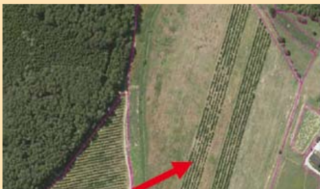
Nepravilno vrisan GERK (trajni nasad mora biti ločen GERK in ne del travniškega GERK-a)