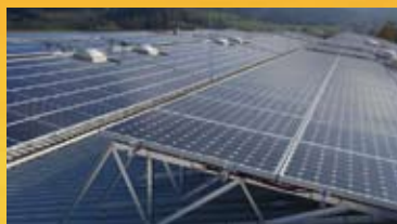
Radlje ob Dravi - 470 kWp