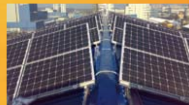
Ljubljana - 77 kWp