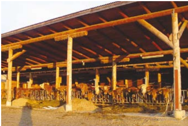
Svetel zračen hlev

mo pristojno veterinarsko službo. Pomembno je zdravstveno stanje kože, dlake, morebitna prisotnost zunanjih parazitov in stanje parkljev. Veliko pozornost moramo posvetiti praskam, vnetjem, oteklina skle-pov, šepavosti, poškodbam seskov in repa, ki so pogosto posledica nepravilno urejenih hlevov in slabega ravnanja z živino. Upošteevamo vse z rejo pogojene bolezni, okužbe in poškodbe živali, ki jih z ustrezno oskrbo lahko preprečimo, zlasti vse kriterije reprodukcije in dolgoživosti.