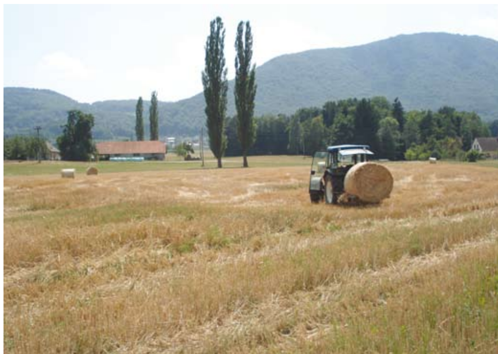
O pogojih pri posameznih ukrepih, rokih, postopkih, urejanju GERK-ov in drugem se pravočasno in čim bolj podrobno pozanimajte!

ja razmerje med variabilnim delom (dodeljene točke) in fiksni delom nespremenjeno v razmerju 45 : 55. Prav tako ostajajo nespremenjeni tudi kriteriji za dodelitev točk na ravni posameznih GERK-ov in kmetijskih gospodarstev.