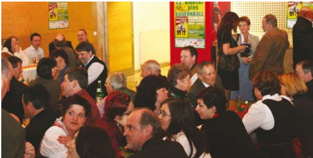
Kulturni dom v Pliberku je bil napolnjen do zadnjega kotička.

Letošnji ples je bil še posebej slovesen, saj je bil to prvi večji javni dogodek južnokoroških kmetov in kmetov po novembrskih volitvah v koroško kmetijsko zbornico, na katerih je lista Skupnosti južnokoroških kmetov in kmetov dosegla velik uspeh, saj je dobila tretji mandat v svetu zbornice. Prekaljenima