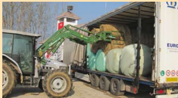
Nalaganje krme v Trebnjem

Sredi poletja je območje občin Bistrica ob Sotli, Podčetrtek, Kozje, Laško, Brežice in Črnomelj zajelo močno neurje s točo. Prizadete so bile vse kmetijske površine v občini Bistrica ob Sotli in velik del površin na Bizeljskem.