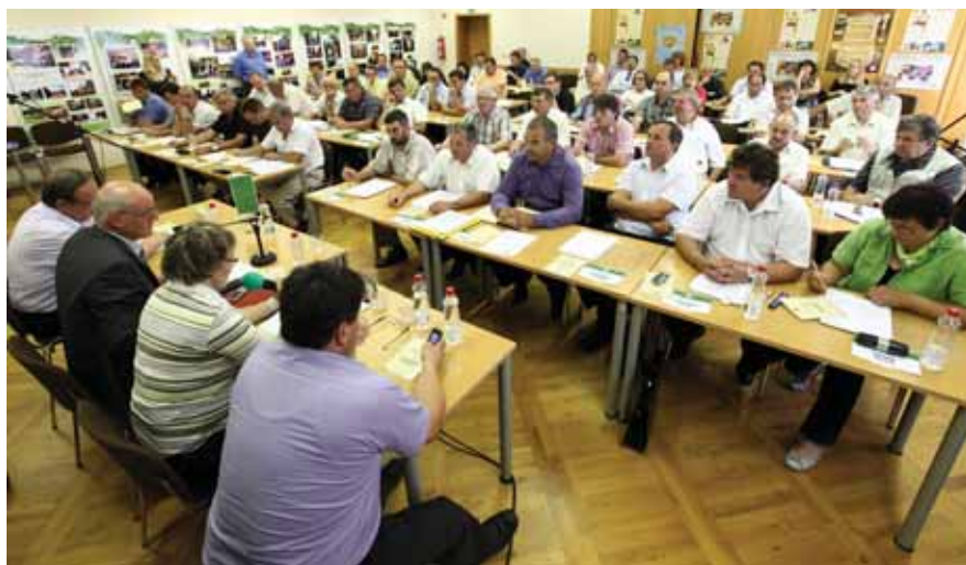
V četrtek, 28. junija, je na Brdu pri Lukovici potekala ustanovna seja novoizvoljene sveta Kmetijsko gozdarske zbornice Slovenije.