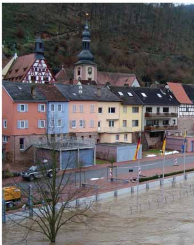
V tujini k proti poplavni zaščiti pristopajo celostno. Primer: Freiburg, Nemčija v času visoke vode

Te sisteme zelo hitro postavimo, v primerjavi z (v tujini) preživetimi protipoplavnimi vrečami so tudi ekonomsko sprejemljivejše, saj po končani nevarnosti elemente shranimo za ponovno uporabo. Največja prednost pa je v logistiki – za shranjevanje potrebujemo malo prostora, za postavitve pa majhno število ljudi.