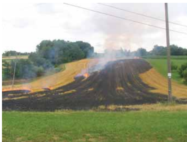
Kurjenje slame

Na lahkih tleh je možno vdlati zmlate žetvene ostanke v tla tudi s krožno ali s kolutno brano, katera mora biti težje izvedbe, z zobčastimi koluti, tandem izvedbe v obliki črke V, da bolje drobi zemljo in meša žetvene ostanke. Tako v svetu kot pri nas testirajo razna večfunkcijska orodja za bolj ali manj poenostavljeno obdelavo in/ali neposredno setev v žetvene ostanke, kar posebej svetujemo na lahkih, toplih in zračnih tleh ter tam, kjer je nevarnost erozije.