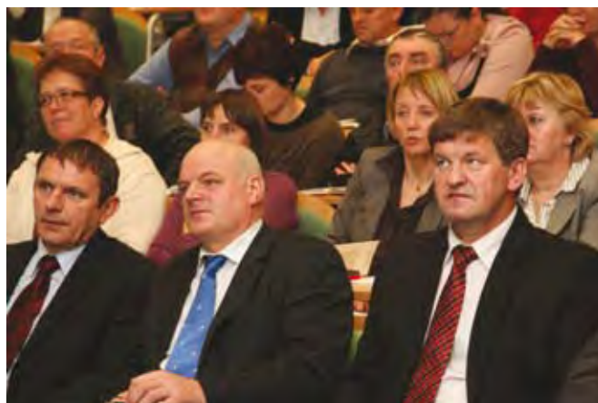
Na dogodkih so sodelovali pomembni predstavniki kmetijskih organizacij.

Tudi letošnji 27. tradicionalni posvet kmetijske svetovalne službe je bil tokrat v znamenju skupne kmetijske politike. Razstava SKP je bila na ogled 14 dni. Posveta se je udeležilo več kot 450 kmetijskih svetovalcev in ostalih.