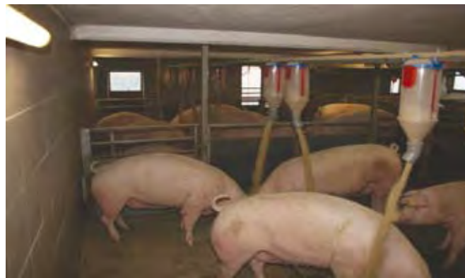
Krmljenje na tla

iz zakonodaje je, da moramo zagotoviti po plemenski svinji 2,25 m 2 površine, za plemenske mladice pa 1,64 m 2 . Najkrajša stranica boksa je