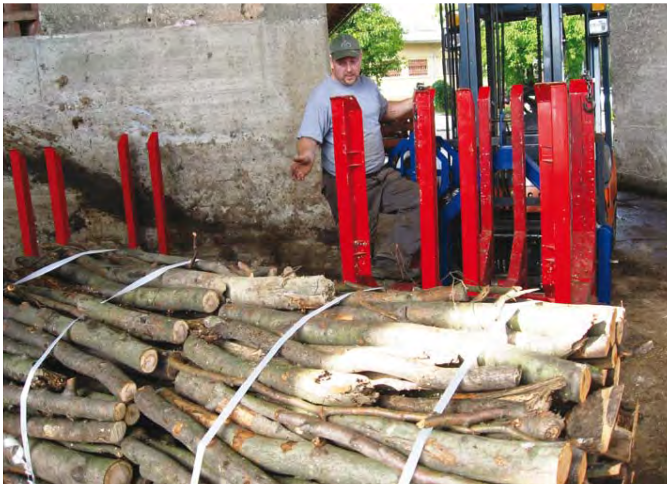
Priprava drv s pomočjo povezovalnika je hitrejša, lažja in varnejša.

Na podlagi dolgoletnih izkušenj in lastnega znanja je iz-