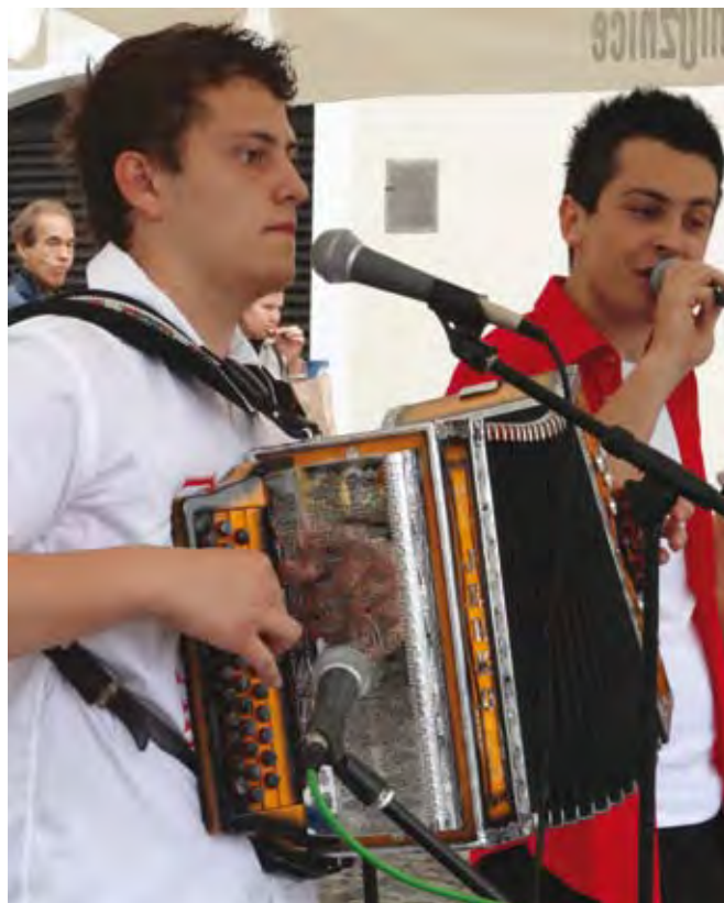
Prireditve so popestrili mladi glasbeniki.

Na šestih prireditvah Podeželje v mestu, ki so potekale od marca do septembra v Kopru, Ljubljani in Mariboru, so na skupaj 200 stojnicah svojo ponudbo pridelkov in izdelkov dopolnilnih dejavnosti predstavljale kmetije. V okviru projekta smo izvedli izobraževanje o pomenu SKP, ki se ga je udeležilo 40 sodelujočih kmetij. Stojnice so bile označene z