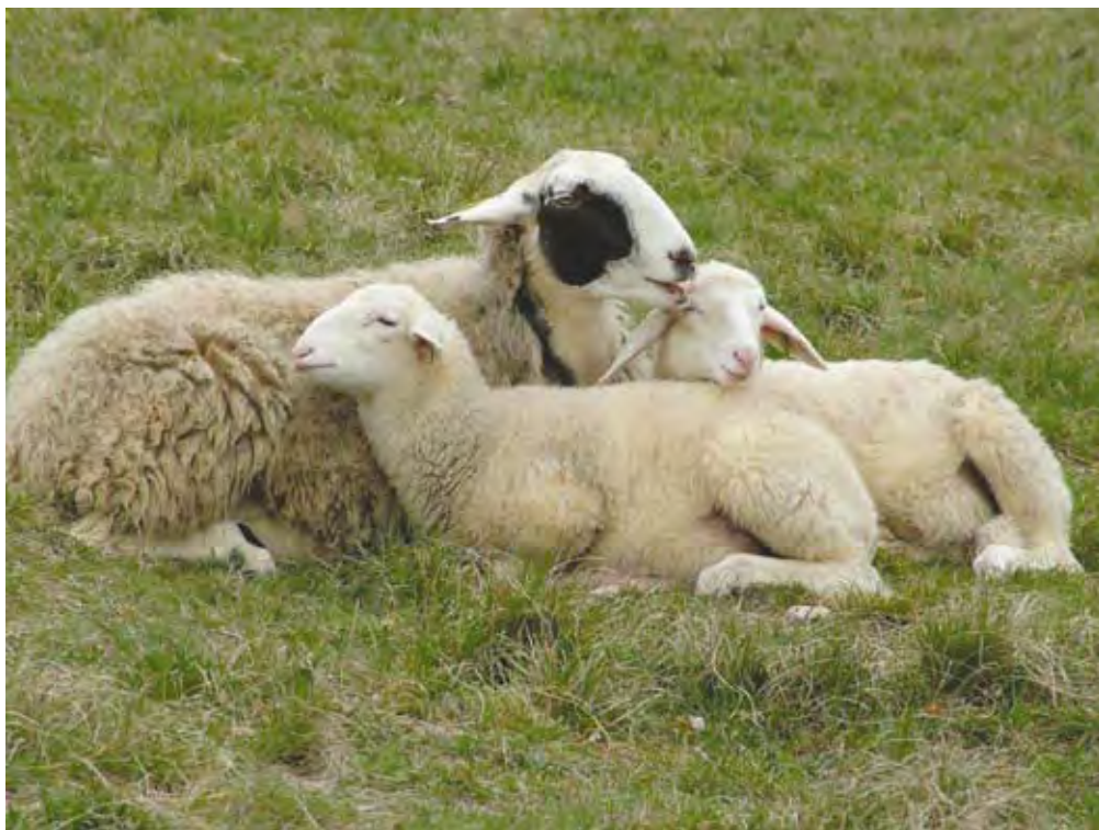
Pri počitku

Najpomembnejše obdobje vzreje jagnjet je prav gotovo obdobje do odstavitve, ko je jagnje v celoti ali delno odvisno od materinega mleka. Zelo pomembno je, da jagnje takoj po rojstvu dobi dovolj mleziva, saj vsebnost protiteles v mlezivu po porodu hitro pada, prepustnost črevesne sluznice jagnjet pa je največja v prvih 36 urah. Z mlezivom se prenese pasivna in aktivna imunost z matere na mladiča. Po prvem mesecu starosti jagnjeta že tvorijo svoja protitelesa. Takrat moramo biti po-