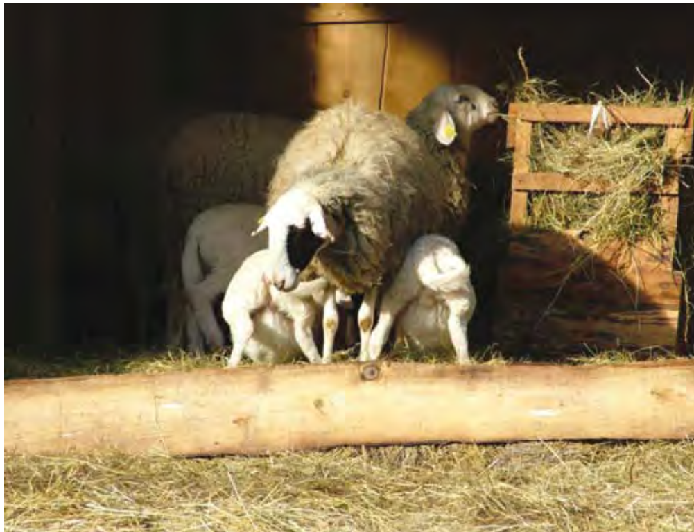
Oskrba dvojčkov

Ta metoda je vedno bolj pogosta v tropih, kjer redijo oplemenjeno jezersko-solčavsko pasmo in manj v tropih z avtohtono jezersko-solčavsko pasmo, predvsem zato, ker lahko ovce prej pripustijo. Ovce poliestričnih pasem se namreč po odstavitvi močno mrkajo in dajejo večja gnezda, kot če jih pripuščamo v času laktacije (Zagožen, 1981). Pri zgodnjem odstavljanju odstavimo 5 do 6 tednov stara jagnjeta. Poznejša odstavitev naj ne bi imela več ugodnega učinka na pojav estrusa in s tem na boljšo plodnost (Zagožen, 1981). To potrjujejo tudi Hulet in sod. (1983), kjer so ugotavljali razliko v plodnosti ovc med skupinami ovc z različnim časom odstavitve, in sicer med odstavitvami jagnjet pri starosti 31, 41 in 80 dni. V primeru, ko so bila jagnjeta rojena v zgodnjem zimskem obdobju in odstavljena pri starosti 31 dni, se je obrežilo več ovc (35,7 %), ki so ponovno jagnjile v poletju, kot pa če so bila jagnjeta odstavljena kasneje, to je pri starosti 41 dni. V tem primeru se je ponovno obrežilo samo 23,6 % ovc. V plodnosti in obdobju med jagnjivama pa niso ugotovili statistično značilnih razlik med skupino ovc, ki so jagnjile poleti (odstavitev pri starosti 80 dni), in ovcami,