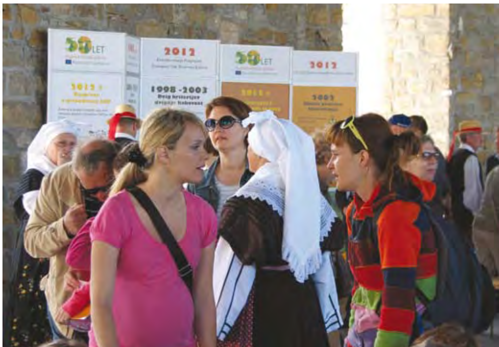
Zgodba o SKP je dosegla vsaj pol milijona prebivalcev Slovenije.

goča, da Mukec na prireditvah oživi, nagovarja otroke in popestri dogajanje.