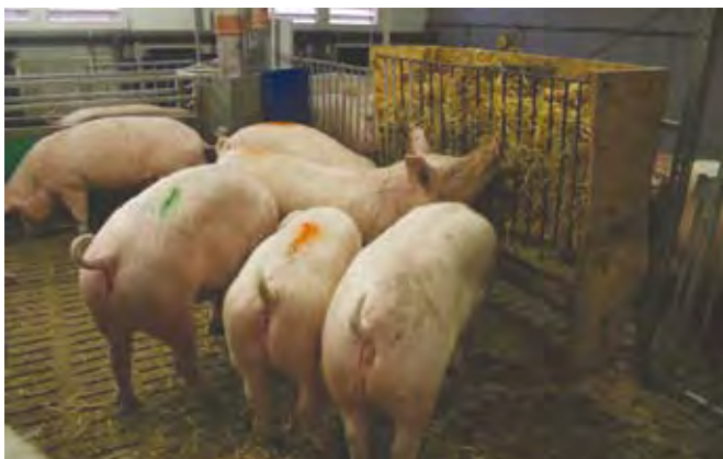
Dodajanje slame v bokse za potrebe žvečenja in ritja

Najbolj idealna rešitev je zagotoviti tri površine boksa: krmni del, tekališče za blatenje in ležalni del. V tem primeru ima