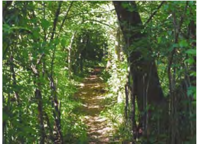
V Sloveniji tudi zasebni gozdovi nudijo vsem prebivalcem neprecenljive vrednote.

Nikakor ni sprejemljivo, da bo potrebna prevoznica tudi za les, namenjen domači porabi (les za kurjavo, gradbeni les ...), saj evropska uredba o določitvi obveznosti gospodarskih subjektov, ki dajejo na trg lesne proizvode, tega ne zahteva niti ne določa. Govori le o lesu, ki se daje prvič na trg, les za domačo porabo pa ne gre na trg. Po predlogu zakona bo na tem področju pri nas zahtevano od lastnika več, kot bi bilo potrebno gle-