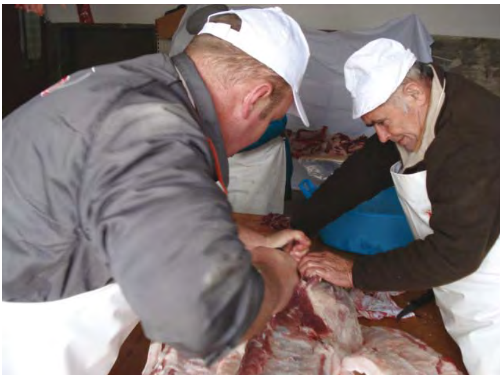
Za boljše koline je treba upoštevati pravilne postopke pred in med klanjem.

Takoj po zakolu potečejo v mesu biokemični procesi, ki vplivajo na mehko in boljše okusnost mesa. Če so gospodinjje preveč »pridne« in premalo poznajo pomen zo-