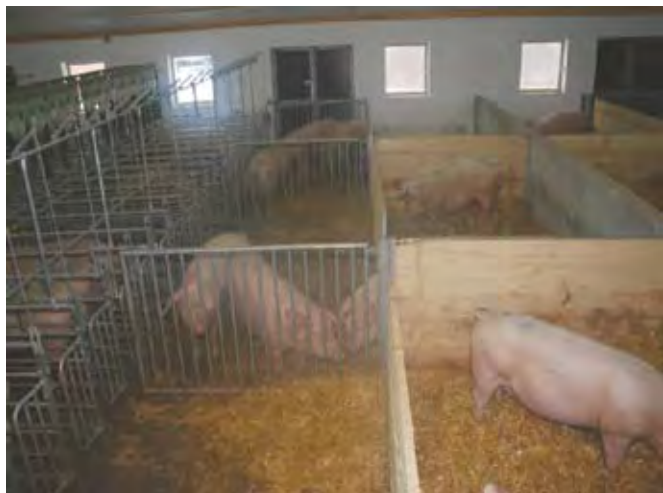
Boks s tremi površinami (krmna, tekališče, ležalna)

jo živali na razpolago tri površine. Pri koritih so pregrade, ki preprečujejo medsebojno napadanje, in v tem delu so polna tla. Tekališče ima praviloma rešetkasta tla, cenejša varianta je tekališče s polnimi tlemi z uporabo nastilja. V tem primeru strojno odstranjujemo gnoj s površine tekališča. Ležalni del je urejen s polnimi tlemi in nastiljem.