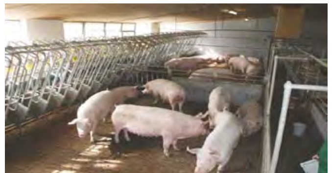
Dvižne pregrade, ki so spuščene v času krmljenja