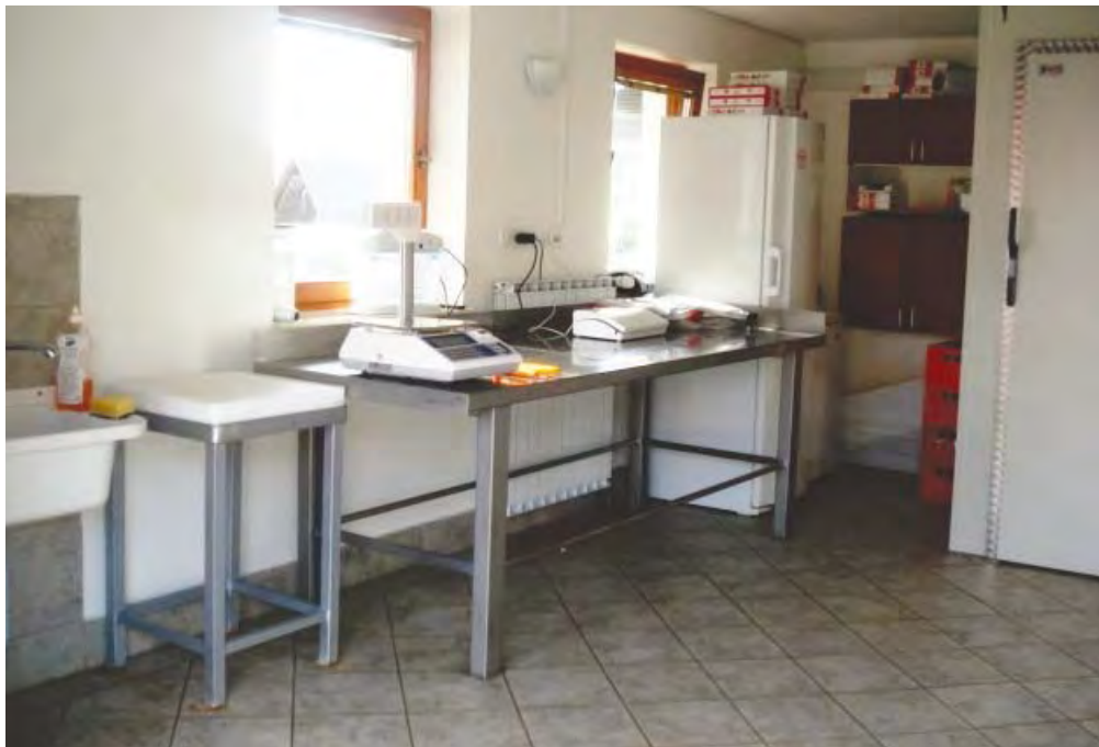
Urejen prostor za prodajo surovega mesa na kmetiji Jenšterle.

Trup ohladimo postopno, v največ šestih urah do 20 OC v središču trupa in v 24-ih urah do 7 OC. Če želimo imeti okusno meso in kakovostne izdelke, se mora meso postopoma, v 24-ih urah ohladiti. V naslednjih 24-ih urah moramo meso pripraviti za nadaljnjo predelavo ali pa »pospraviti« v skrinjo. Če meso ne »odleži«, ne bo nikoli tako zelo okusno in tudi struktura bo slabša.