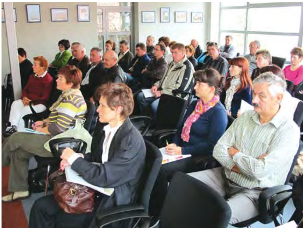
Udeleženci tretje Borze za lokalno oskrbo so z zanimanjem prisluhnili predstavitev ponudbe ekoloških kmetij jugovzhodne Slovenije.

lave, katere ponudba je v JV Sloveniji še vedno izredno nizka. Za ekološko in biodinamično pridelavo, ki je najbolj trajnostno naravnana in z najmanj negativnimi vplivi na okolje, je še veliko poslovnih priložnosti – predvsem za manjše kmetije. Povpraševanje po ekoloških pridelkih in izdelkih bo naraščalo tudi s strani javnih zavodov in le-ti bi morali biti po nabavi ekološkega blaga zgled zasebnemu sektorju. Na srečanju smo govorili tudi o pripravi razpisne dokumentacije in o ciljih, ki si jih je pri javnem naročanju potrebno zastaviti, če želimo povečati nabavo lokalne in ekološke hrane v javnem sektorju, ki bi lahko konkretno prispeval k ciljem politike za povečanje samooskrbe s hrano v Sloveniji. Predavateljica je poudarila pomen izvajanja javnega naročila in načine, kako lahko vplivamo na kakovostne premike v slovenskem kmetijstvu, ponudimo otrokom, mladostnikom, starejšim in bolnikom kakovostno hrano lokalnega slovenskega porekla, vzpodbujamo