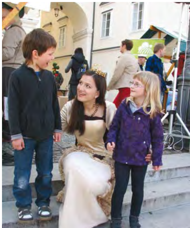
Zgodbo o SKP je na prvi prireditvi Podeželje v mestu pripovedovala vinska kraljica Slovenije 2012.

logotipom 50 let SKP. Skupaj z ljudski pevci, godci, plesalci in rokodelci so predstavljale kulinarčno in kulturno dediščino podeželja. Po prireditvenem prostoru se je sprehajal Mukec, delil zgibanke, balone, obeske za ključke, publikacije EU-komisije na temo kmetijstva in zaplesal z oblikovalci. Prireditve so potekale na mestnih tržnicah in obiskali so jih predvsem prebivalci mestnih jeder in tuji obiskovalci. Najave o prireditvi so se vrtele na radijskih postajah, spletnih straneh, facebooku, tiskanih medijih. Ocenjujemo, da je informacija o SKP prek prireditvev Podeželje v mestu dosegla več kot 300.000 ljudi.