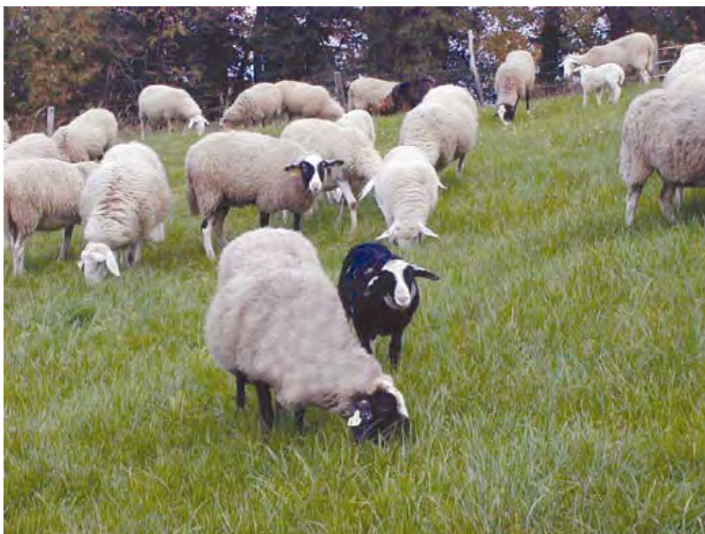
Pitanje jagnjet na paši

» MAG. ANGELA CIVIDINI Biotehniška fakulteta, Oddelek za zootehniko