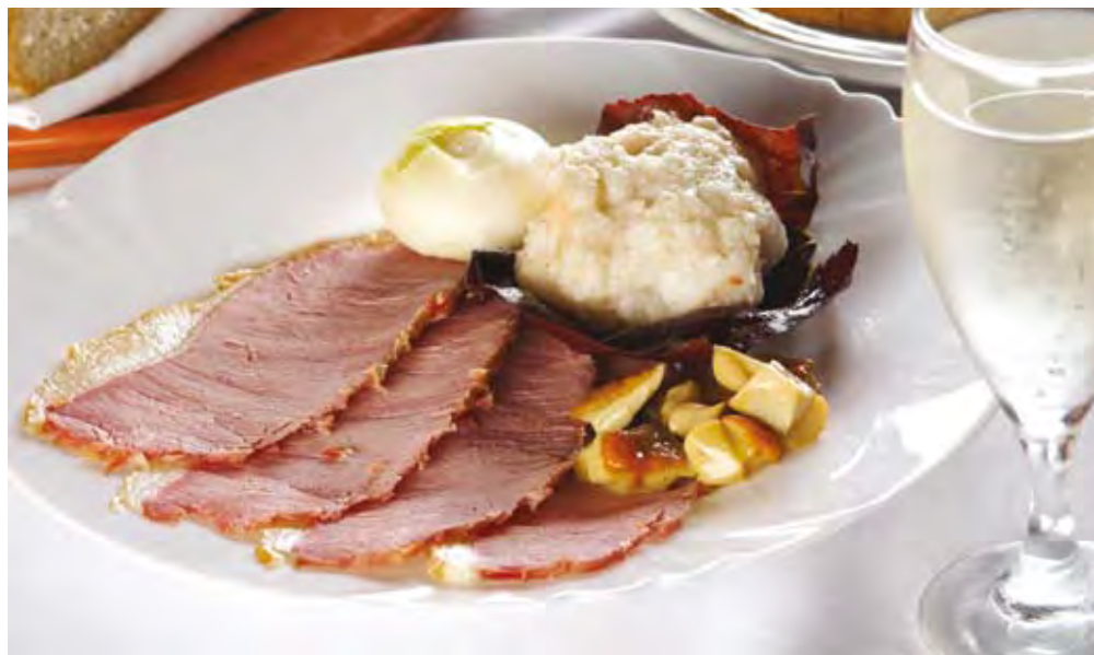
Prleška tünka ima na ravni Evropske unije priznano zaščiteno geografsko označbo.

Od leta 1997 je zaposlena na KGZS – Zavodu Celje. Je diplomirana inženirka živilske tehnologije in je bila do lani svetovalka za kmečko družino in razvoj dopolnilnih dejavnosti. Vseskozi je svoje delo, znanje in izkušnje usmerjala v področje predelave mesa, spremljala je zakonodajo in začela z izdelavo tehnoloških načrtov za obrate za predelavo mesa. Leta 2008 je izdelala tehnološki načrt za prvo vaško klavnico pri nas. Ta obratuje na kmetiji Janka Rutnika v Gorenju nad Zrečami. Pomagala je pri pripravi vse potrebne dokumentacije, da je lahko obrat pričel v okviru dopolnilne dejavnosti opravljati storitveno klanje za okoliške rejce. Letos je z njeno pomočjo začelo z obratovanjem na kmetijah pet klavnic in veliko manjših obratov za predelavo mesa. Ima tudi licenco za preverjanje in potrjevanje NPK s področja predelave mesa.