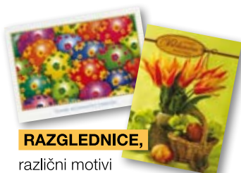
RAZGLEDNICE, različni motivi