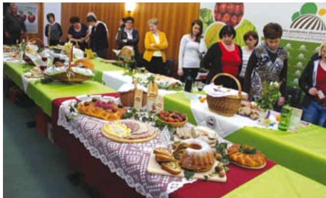
Pripravljeni pogrinjki so bili prava paša za oči.

Na ocenjevanju so sodelovale kmetije Babič iz Župečje vasi na Dravskem polju, Balon z Bizeljskega, Brezovnik iz Mute, Cernatič iz Šempasa, Čelofiga iz Spodnjih Jablan pri Cirkovcah, Golob iz Zlatoličja, Perc iz Vodrancev pri Kogu, Pribožič z Dečnega sela pri Brežicah, Ratej z Lačne gore pri Oplotnici in Vargazon iz Cvena pri Ljutomeru.