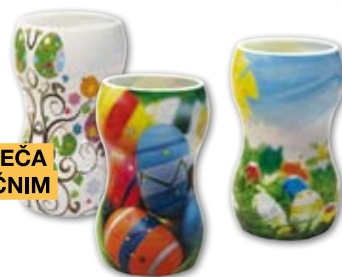
OKRASNA SVEČA Z VELIKONOČNIM MOTIVOM