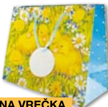
DARILNA VREČKA, velikost A 5 velikost A 4