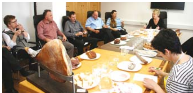
Sočasna poskušnja izdelkov je najboljši način za izboljšanje znanja predelovalcev mesa na kmetijah in kakovosti njihovih mesnih izdelkov.

»Prav tako opažamo primere, ko se mesni izdelki razvažajo po domovih brez zahtevane opreme (vozila s hlajenjem) in ustrezne označitve izdelkov. Zato naj potrošniki posegajo po mesnih izdelkih tistih predelovalcev mesa na kmetijah, ki izpolnjujejo predpisane zahteve in prodajajo izdelke na za to predvidenih mestih za prodajo.