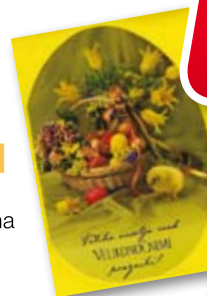
VOŠČILNICE, različni motivi, kuverta priložena