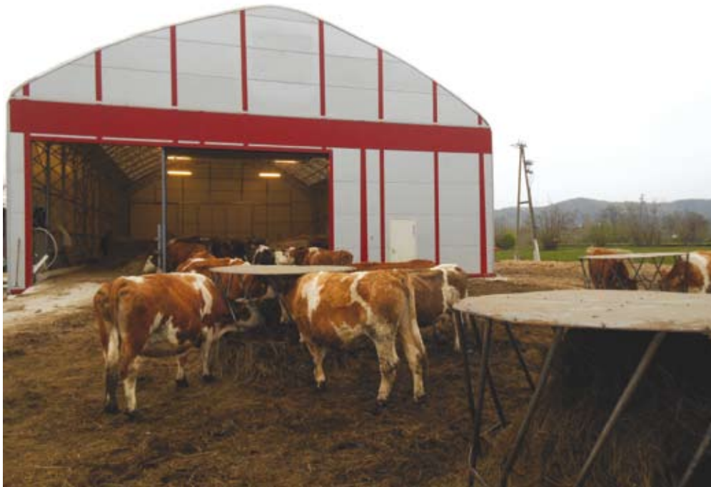
Lansko jesen so postavili preprost hlev oziroma šotor, da lahko živalim pozimi nudijo več udobja in da je delo pri oskrbi živali lažje.

kmetiji. Ker ni imel ustrezne kmetijske izobrazbe, je moral pridobiti tudi nacionalno poklicno kvalifikacijo s področja živinoreje.