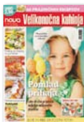
REVIJA NAŠ DOM