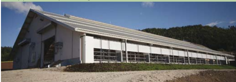
Kmetija Potočnik in njihov novi hlev

Na podlagi izkušenj pri gradnji našega hleva bi pri bodoči gradnji marsikaj spremenila. Tako bi najela strokovnjaka od izdelave projektne dokumentacije naprej, ki ga tokrat nismo imeli, pa vse do dokončanja investicije in pridobitve EU sredstev. Prav tako bi najela dobrega projektanta z znanjem kmetijske in svoje stroke, ki bi izdelal podroben projektantski popis, ki je žal v večini primerov nepopoln, kar pripelje do veliko nepredvidenih stroškov zaradi dodatnih del. Natančno bi tudi uredila primopredaje med posameznimi izvajalci in sklenila pogodbe o nadaljnjem servisiranju hlevske opreme.