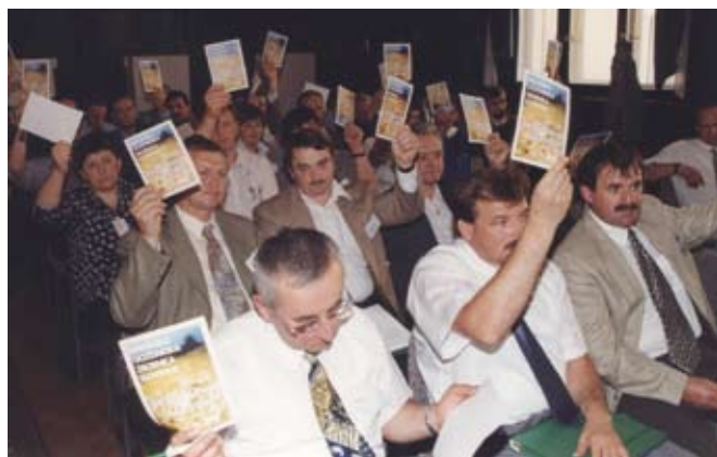
Ustanovna seja sveta KGZS je potekala 12. maja leta 2000.

Po mnenju US ravno obvezno članstvo in članarine zagotavljajo uresničevanje temeljnih nalog zbornice, saj bi brez obveznega članstva grozila nevarnost, da bi se članski krog zmanjšal, zbornica pa bi izgubila transparentnost.