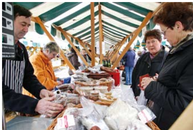
Zbornica je povezovalni člen med mestom in podeželjem, hkrati pa so nekatere prireditve, kot je recimo Podeželje v mestu , pomenile pomemben korak k bolj tržni usmeritvi slovenskih kmetij.