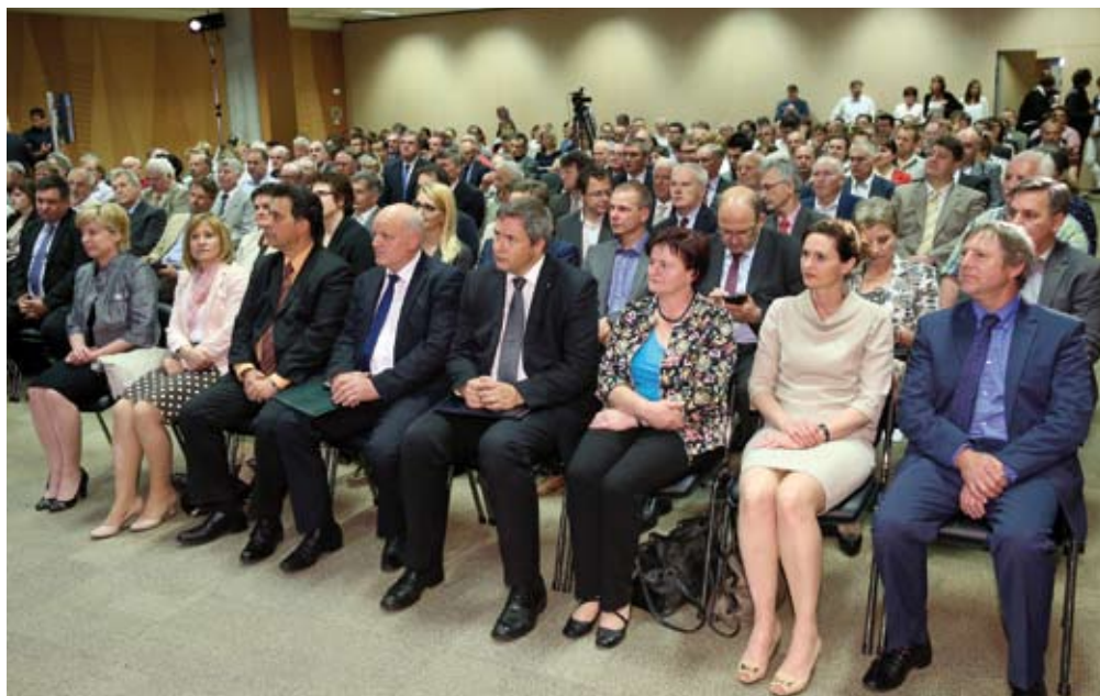
Dvorana Povodni mož na Gospodarskem razstavišču je bila nabito polna.

Skozi vsebino posameznih točk na prireditvi je prevlado-