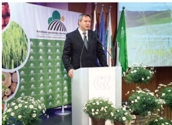
Častni govornik je bil minister za kmetijstvo, gozdarstvo in prehrano mag. Dejan Židan.