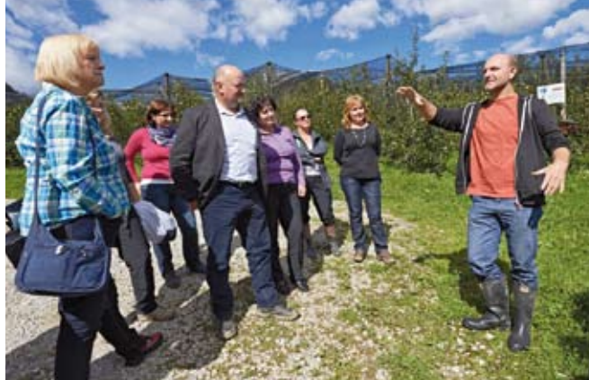
Kmetijska svetovalna služba je most med znanostjo in prakso.

Zbornica ima obvezne organe, ki so voljeni na neposrednih volitvah vsaka štiri leta. To so svet zbornice, predsednik in dva podpredsednika, upravni in nadzorni odbor, častno razsodišče in stalna arbitražna. Na regionalni ravni deluje trinajst svetov območnih enot, na ravni upravnih enot pa 59 odborov izpostav.