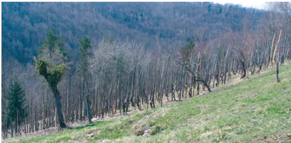
Uredba prinaša tudi nekaj novosti pri gnojenju strmih zemljišč.

Količina oddanih, prodanih ali na drug način odstranjenih živinskih gnojil mora biti izka-