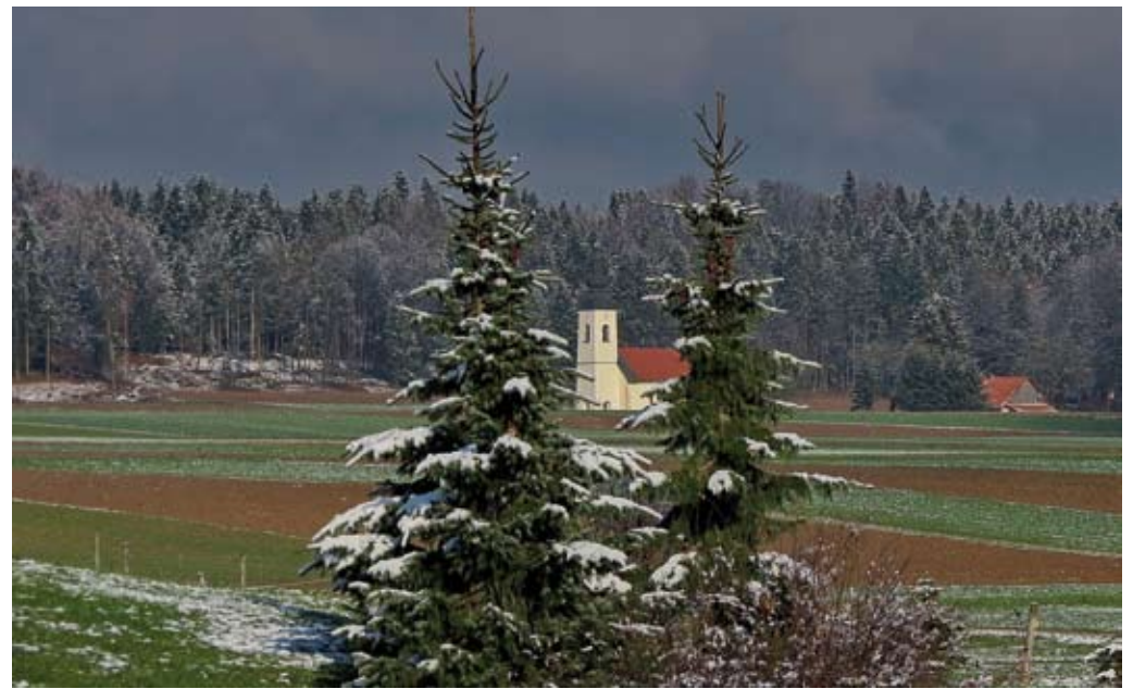
Zaščita kmetijskih in gozdnih zemljišč ohranja kulturno krajino, njene tradicionalne značilnosti in etnografske posebnosti ter spodbuja nacionalno identiteto.

vrednost nepremičnin brez vpliva spekulativnih transakcij mogoče določiti tudi z uporabo dohodkovne metode vrednotenja na podlagi dostopnih podatkov iz uradnih evidenc. Na voljo so podatki o površini, nagibu, nadmorski višini in boniteti zemljišč, rastiščnem koeficientu, pravilni razdalji v gozdu ter drugi, na podlagi katerih bi bilo mogoče s slednjo metodo množično določiti vrednost kmetijskih in gozdnih nepremičnin.