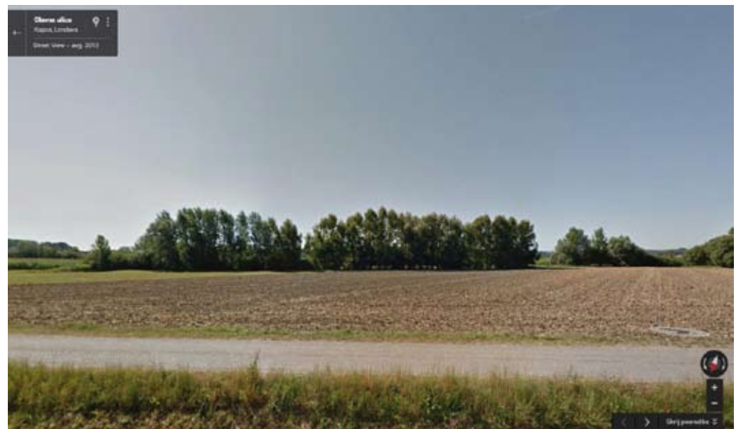
Kmetijsko zemljišče z mejico v ozadju in ista površina vrisane mejice v GERK pregledovalniku. Rumena črta ponazarja mejico, z zeleno označen pas predstavlja en rob mejice in z rjavo označen pas drugi rob mejice, kar pomeni, da mejico lahko uveljavljajo lastniki GERK-a na obeh straneh, vsak za dolžino, pripisano njegovemu GERK-u.

strani Agencije in KGZS ali v GERK pregledovalniku ( http://rkg.gov.si/GERK/WebViewer ), kjer si vsak nosilec lahko, z vklopitvijo sloja mejic, ogleda na svojih GERK-ih, kje in v ka-