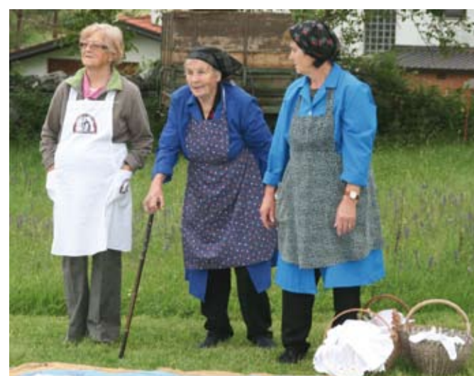
Zavarovanje za ožji obseg pravic vključuje le pravico do starostne, invalidske, vdovske in družinske pokojnine, ne pa tudi drugih pravic.

Nekoliko drugače je s tistimi kmečkimi zavarovanci, ki so bili pred uveljavitvijo ZPIZ-2 zavarovani za ožji obseg, ter s tistimi, ki so ostali zavarovani na zavarovalni osnovi iz decembra leta 2012 (torej zadnji znani zavarovalni osnovi pred uveljavitvijo novega zakona). Prvi so tisti, ki so bili pred uveljavitvijo ZPIZ-2 zavarovani za ožji obseg, vendar so ob spremembi prešli na novo zavarovalno osnovo. Ti so od 1. januarja 2013 dalje zavarovani za širši obseg. Za vsa leta prej pa