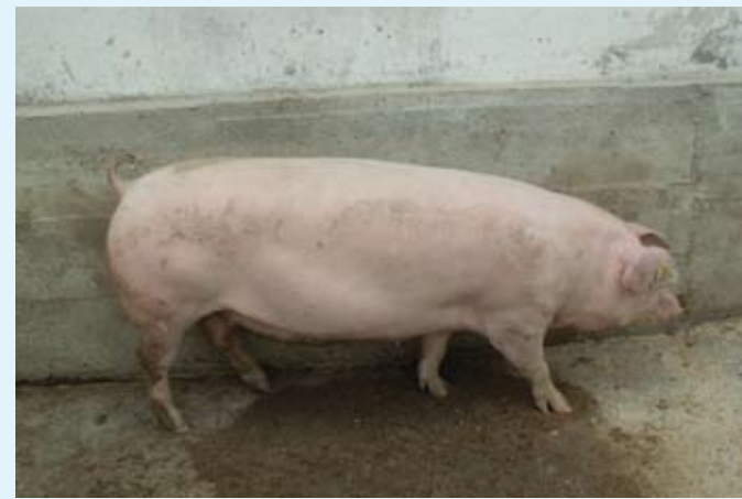
Plemenska mladica hibrida 12

V 137. številki revije Zelena dežela (oktober 2016) je v članku »Izvor plemenskega podmladka in rezultati plodnosti« ponagajal tiskarski skrat. Pod sliko plemenske mladice hibrida 12 je bil objavljen podpis Mladi merjasec pasme pietrain . Obe sliki s prvim podpisom objavljamo ponovno.