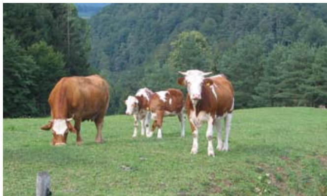
V letu 2017 ni mogoče vstopiti v vse operacije in zahteve ukrepa KOPOP. Je pa možno vstopiti med drugim v operacijo Planinska paša.

V okviru ukrepa operacija Poljedelstvo in zelenjadarstvo (POZ) in operacija Vodni viri (VOD) je kar nekaj sprememb. Zahteva POZ_NMIN in VOD_FFSV: V zahtevo je mogoče vključiti tudi površino, na