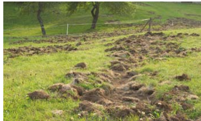
Posledice »obiska« divjih prašičev

po zavarovanih vrstah (medved, volk, ris ...) je odgovorna Republika Slovenija. Škodo prijavi oškodovanec v roku treh dni s pisno prijavo pooblaščenca, ki ga minister določi z odločbo. Pooblaščenca ministra so uslužbenci Zavoda za gozdove Slovenije (odsek za gozdne živali in lovstvo).