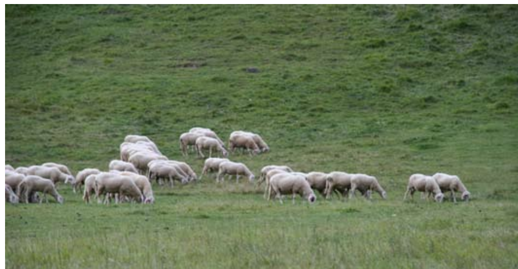
Za pridobitev plačil za DŽ – drobnica mora upravičenec izvajati pašo drobnice.

Plačilo za operacijo DŽ – drobnica se dodeli za ovne, starejše od enega leta, in ovce, ki so starejše od enega leta oziroma so že jagnjile, ter kozle, starejše