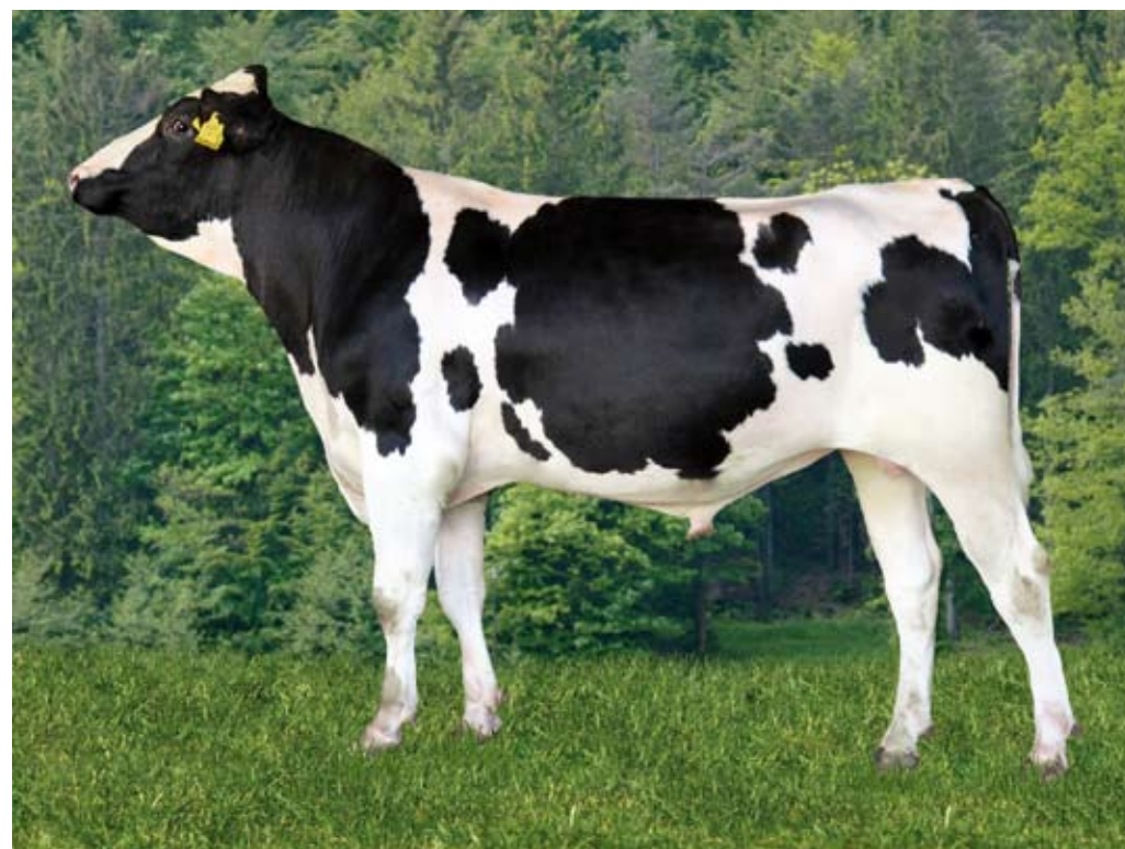
Bik Osatt 131759 (+435 kg; +32/+0,07 %; +27/+0,18 %) izboljšuje vsebnost beljakovin in maščob v mleku, prav tako telesne lastnosti potomk – okvir, noge in vime. Telitve po njem so lahke. Je odličen vsestranski bik, kar dokazuje tudi skupni selekcijski indeks 121.

Domača selekcija operira s podatki, pridobljenimi na slovenskih živalih, rejnih v slovenskih razmerah. To ji daje večjo zanesljivost selekcijskih indeksov, kar za rejca pomeni, da je napovedna vrednost plemenskih živali višja in zanesljivejša. Rezultat tega pa je večje število dobrih in izenačenih živali v proizvodnji, tako mlečni kot mesni.