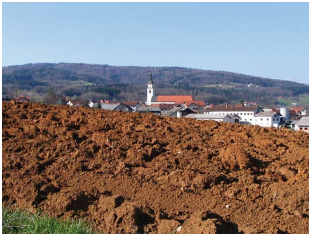
Prag 7.500 evrov, nad katerim so se kmečka gospodinjstva dolžna identificirati za namene DDV, je občutno prenizek.

nju Zakona o davku na dodano vrednost) področje upoštevajo velika števila kmetij, smo pisali v prejšnji številki Zelene dežele. S Finančne uprave RS (FURS) smo naknadno prejeli podatke o številu vseh obveznikov. Teh je 1.279 in kar 789 od njih se je moralo na novo vključiti v sistem DDV. nju Zakona o davku na dodano vrednost) področje upoštevajo velika števila kmetij, smo pisali v prejšnji številki Zelene dežele. S Finančne uprave RS (FURS) smo naknadno prejeli podatke o številu vseh obveznikov. Teh je 1.279 in kar 789 od njih se je moralo na novo vključiti v sistem DDV.