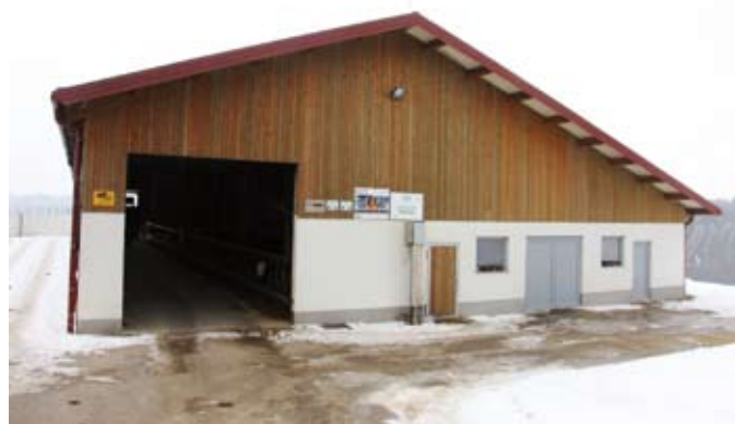
Nov hlev so zgradili leta 2014.