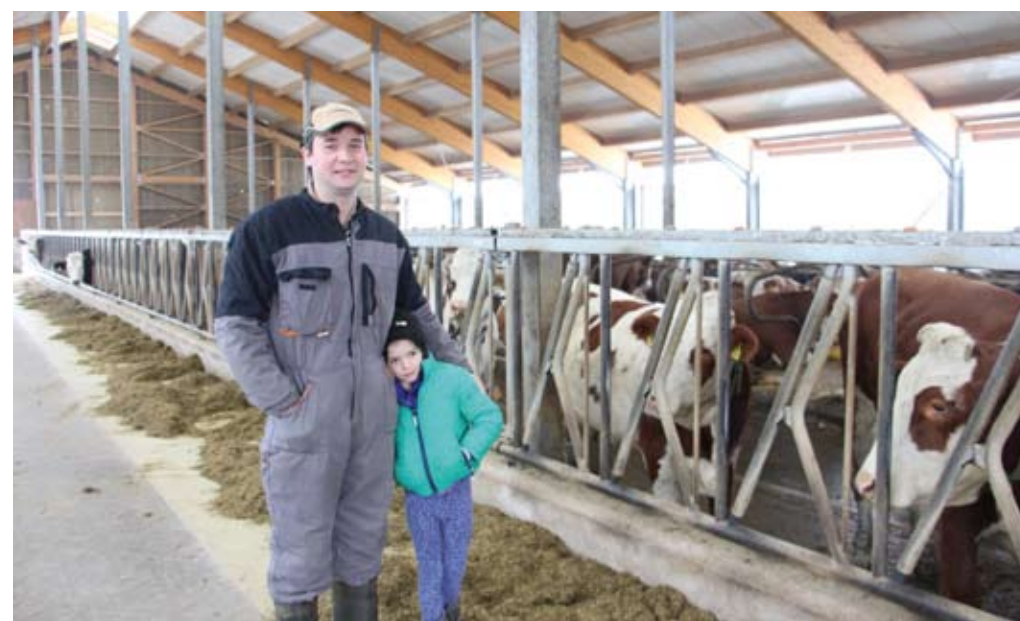
Za podmladek pri hiši je poskrbljeno.

Kmetija je bila že pred desetletji med večjimi, prav tako so imeli že prosto rejo za okrog 60 glav. Pred dobrimi petimi leti pa so se začele pripravice na izgradnjo večjega hleva. Leta 2013 so zbrali potrebno dokumentacijo in kandidirali za sredstva na razpisu, ki so jih tudi pridobili. Iz teh so zgradili hlev z molziščem ribja kost 2 x 6, silose,