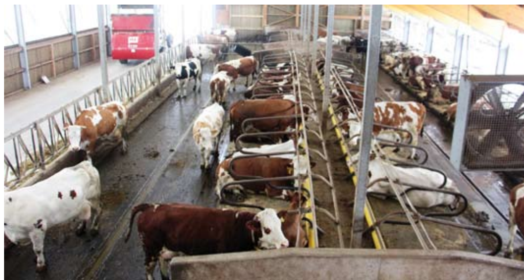
V hlevu je 68 ležišč za krave.

gnojno jamo, mešalno-krmilno prikolico, nekaj priključkov in uredili dvorišče. Naložba je vredna 550.000 evrov, od tega je bila lastna udeležba 30-odstotna, 70 pa iz sredstev programa razvoja podeželja – poleg izhodiščnih 50 odstotkov sofinanciranja še 10 odstotkov za mladega kmeta in 10 odstotkov zaradi tega, ker je kmetija na ob-