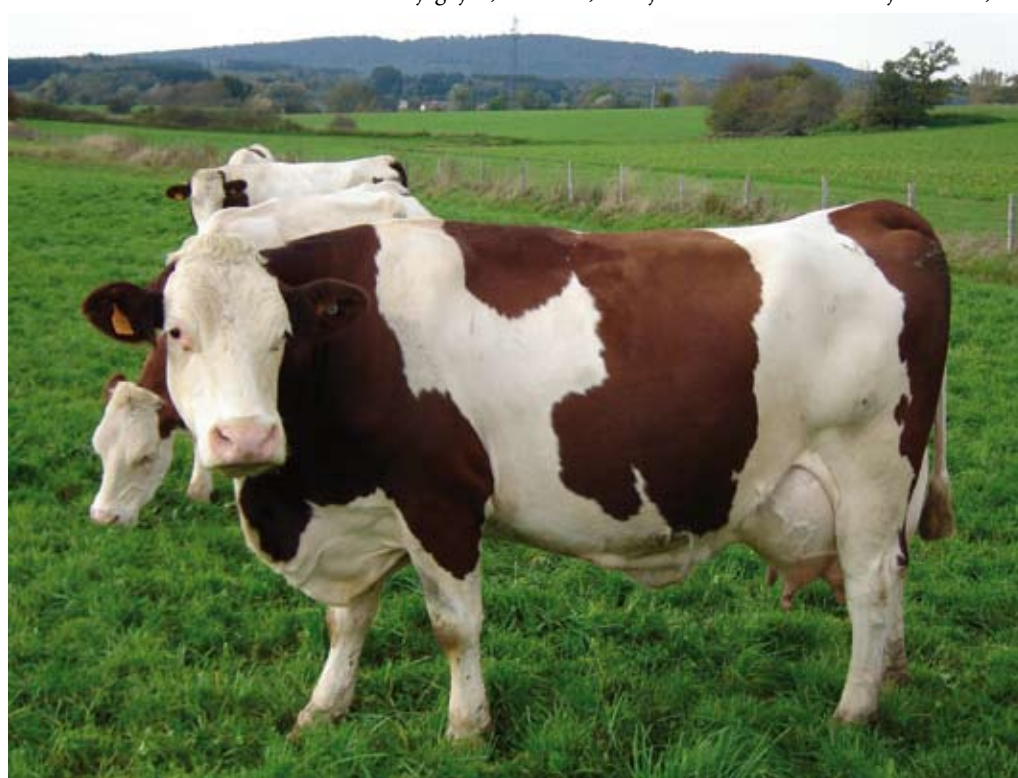
Za živali, za katere nosilec KMG uveljavlja operacijo DŽ – govedo, morajo biti izpolnjene tudi vse zahteve identifikacije in registracije govedi.