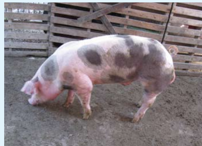
Mladi merjasec pasme pietrain

Plemenske merjasce in mladice, preizkušene v slovenskih razmerah, lahko rejci kupijo na vzrejnih središčih. Iz slovenskega rejskega programa SloHibrid so rejcem ponujeni merjasci slovenska landrace - linija 11 (11), slovenski veliki beli prašič (22), pietrain (44), slovenska landrace - linija 55 in hibrid 54 ter mladice pasme slovenska landrace - linija 11, hibrida 12 ter 21.