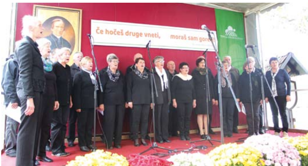
Geslo letošnjega srečanja je bila Slomškova misel: Če hočeš druge vneti, moraš sam goreti.