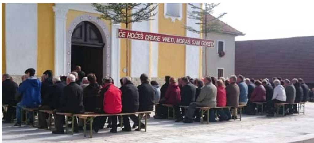
Cerkev je bila premajhna za vse, ki so prisostvovali pri sveti maši.