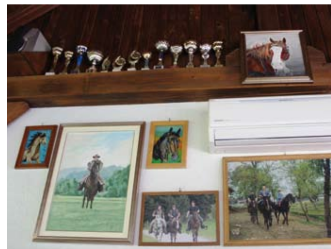
Ljubezen do konj je na kmetiji vidna na vsakem koraku.

uspešni, je bil v letu 2013: razpis 112 za prenos/dedovanje kmetije. Nadaljevalo se je leta 2014 ob prevzemu kmetije z razpisom za ukrep 121 – posodabljanje kmetijskih gospodarstev za naložbe mladih prevzemnikov kmetij ter na razpis za produktivne naložbe v ribogojstvu za posodobitev domače ribogojnice, predlani pa še za ukrep 4.1 nakup mehanizacije za doseganje boljših ciljev – konkurenčnost ter bil na vseh uspešen. Ne zgolj po lastni zašlugi. Za uspeh na razpisu za mladega prevzemnika je hvaležen kmetijskima svetovalkama iz Črnomlja Ani Bahor in Andreji Absec, da so ribe uspešno zaplavale, pa Mihi Štularju, svetovalcu specialistu za ribogojstvo na KGZS – Zavodu Kranj. Pomembno vlogo pri odločitvi za naložbo v ribogojnico je imel še Danijel