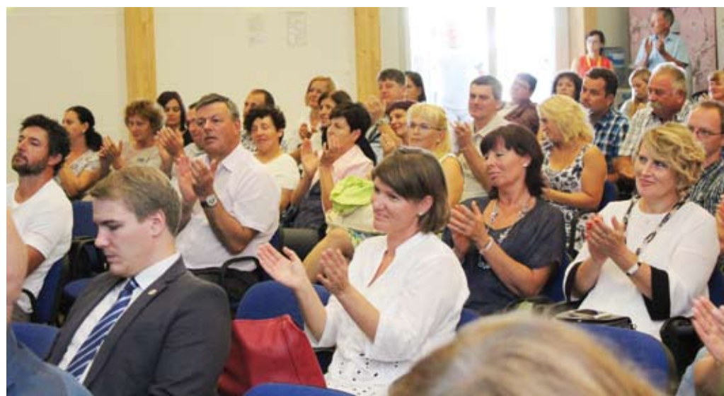
Udeleženci osrednjega dogodka zbornice na sejmu so pozorno prisluhnili in tudi z aplavzom nagradili posamezne govorce.

Izvedenih je bilo kar nekaj promocijskih aktivnosti v obliki organizacije različnih dogodkov in sejamskih nastopov. Med novimi promocijskimi dejavnostmi je izvedba delavnice Hrana ne raste v trgovini po