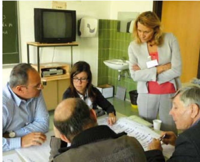
Dve od delavnic so pripravili in vodili predstavniki KGZS.

okolja, je bila predstavljena analiza slovenskega podeželskega prostora, kjer še vedno prevladuje manjše, mešane kmetije, ki imajo dohodek iz različnih virov, in kjer kmetijstvo pogosto ni glavna dejavnost. Imajo pa te kmetije pomembno vlogo pri ohranjanju kulturne krajine in ohranjanju življenja na podeželju. Da bi to vlogo obdržale, potrebujejo dodatne spodbude za uvajanje in razvoj vzporednih oblik dela in zasluzka, ki ga prinašajo dopolnilne dejavnosti na kmetiji. Z vidika trajnostnega razvoja podeželja in ohranjanja naravnega okolja so prav storitvene dejavnosti pomemben potencial. Podeželje kot večfunkcijski prostor, v katerem prevla-