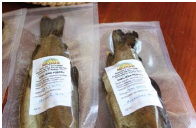
Mlinarjevo dimljeno postrv cenijo vse več poznavalcev dobre hrane.

Vse obdelovalne površine imajo zatravljene, saj zaradi reje postrvi in turistične dejavnosti na kmetiji želijo stroške in porabo časa za rejo 22 krav dojilj pasme limuzin čim bolj zmanjšati. Poleg goveje živine imajo tudi šest konj, ki so namenjeni domačim in gostom za rekreativno jahanje, osliček pa postane zvezda, ko pridejo na kme-