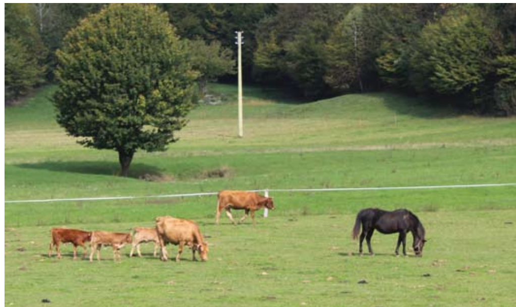
Ekološka reja krav dojilj, ki jim na paši družbo delajo konji in osliček.

»Delamo, kolikor smo zreli,« pravi o prihodnosti in razvoju kmetije Denis in nadaljuje: »Naša prednost je, da imamo različne dejavnosti. Ko gre