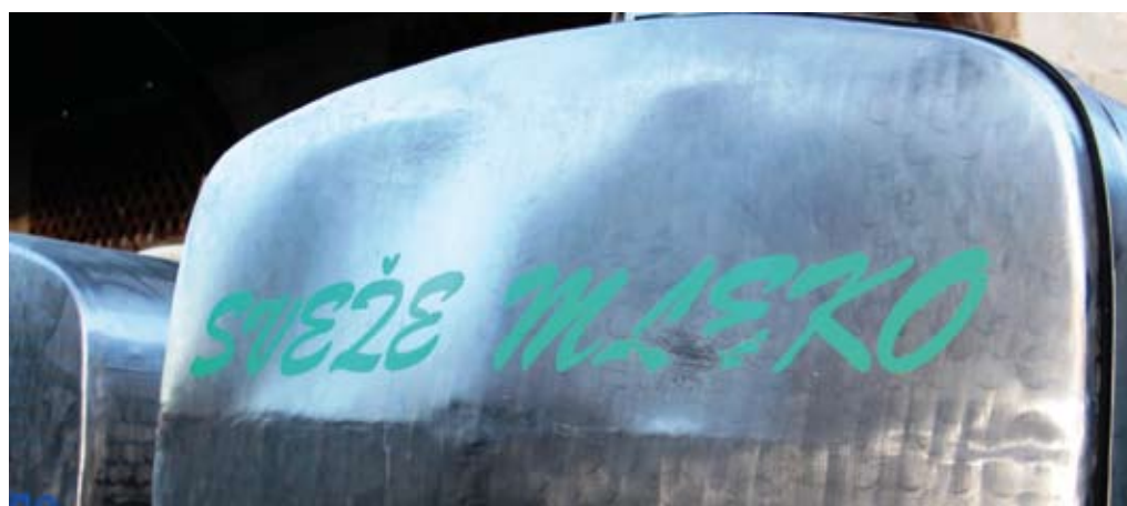
Šola lahko nabavi surovo mleko, vendar ga mora pred razdelitvijo toplotno obdelati

Zelenjava: paradižnik, zelje, ohrovt, kolerabica in koleraba, cvetača, brokoli, solata (lactuca sativa), radič, korenje, rdeča redkvice, peteršilj, zelena (gomoljna), rdeča