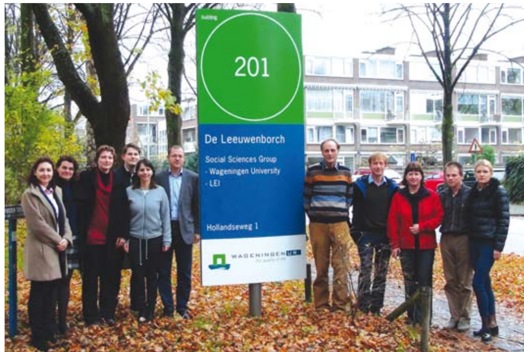
V okviru evropskega programa Erasmus+ se izvaja triletni raziskovalni projekt ISM+ »Podjetništvo z vizijo«, v katerem sodeluje deset partnerjev iz šestih držav, tudi iz Slovenije.

Nizozemskem. Ta inovativna metoda temelji na teoriji strateškega upravljanja in se v praksi ukvarja z oblikovanjem strategije za različne tipe kmetij. V okviru ISM+ projekta želimo metodo Interaktivnega strateškega razmišljanja (ISM metodo) razširiti na kmetijske proizvajalce različnih kmetijskih sektorjev (prireja mleka, mesa, rastlinska pridelava, govedoreja, prašičereja, čebelarstvo ...), kmetijske svetovalce in študente kmetijskih fakultet (predvsem tiste skupine študentov, ki bodo prevzemniki kmetij oziroma bodo kot kmetijski svetovalci soočeni s strateškimi usmeritvami kmetij na njihovem območju).