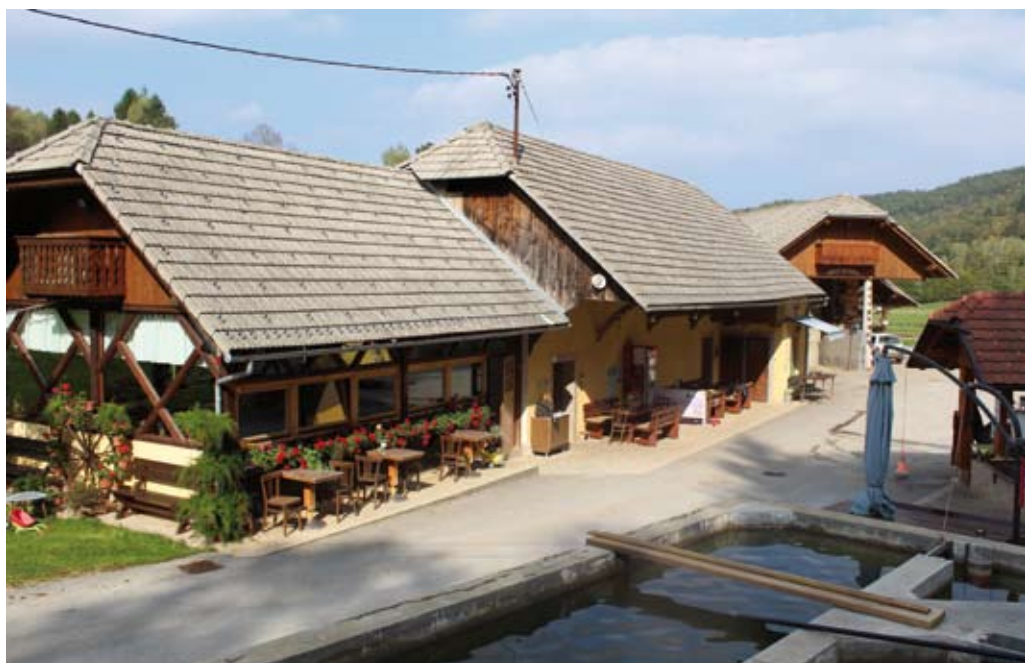
Spredaj so trije ribniki, ki se preko dvorišča spogledujejo z objektom za turistično dejavnost na kmetiji, kjer gostje iz prve roke poskusijo kakovost prirejenih rib.