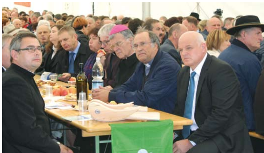
Tradicionalno srečanje je letos na Slom pritegnilo več kot tisoč ljudi.

»Hrana je dar, ki ga mi ljudje pripravljamo drug drugemu, saj je za to, da pride kos kruha na mizo, treba vsaj osem ljudi: tisti, ki je oral, sejal, požel, peljal v mlin, zmel, spekel, prodal in dal na mizo,« je povzdignil poslanstvo kmetov škof Lipovšek.