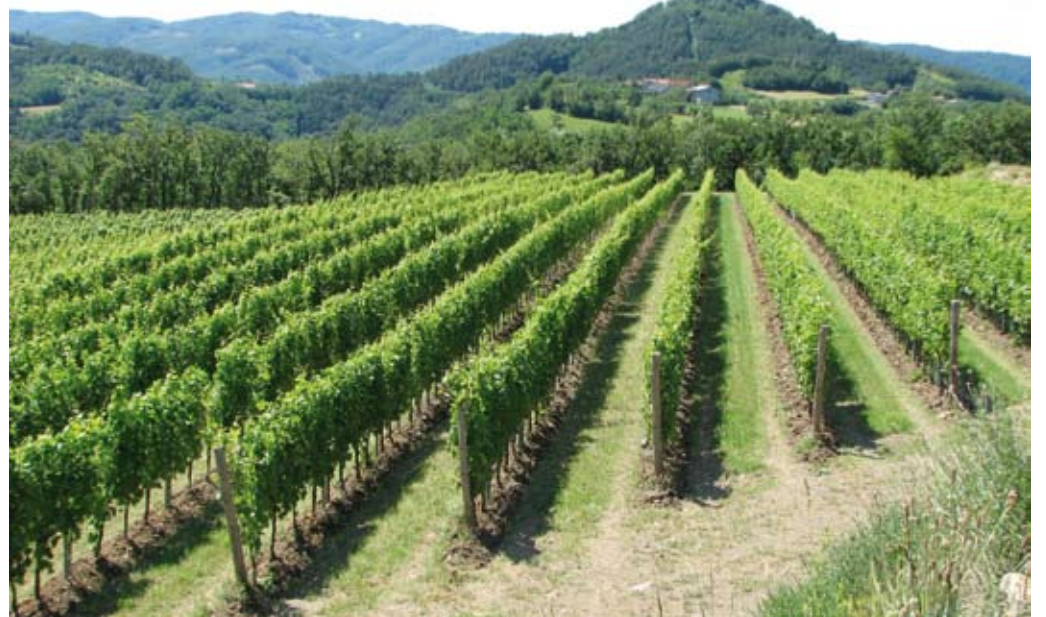
Ekološko vinogradništvo ni ekstenzivna panoga, ampak delovno zelo intenzivna panoga. Zahteva več ur ročnega dela kot konvencionalno.

Pravilno in pravočasno izvedena zelena dela so še bolj pomembna kot v konvencionalni pridelavi grozdja. Z njimi namreč doseže-