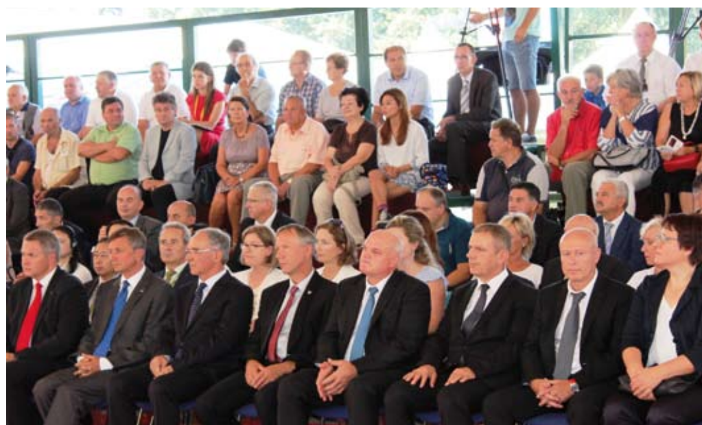
Sejem ne mine brez vseh, ki pomembno sooblikujejo slovensko kmetijstvo in kmetijsko politiko.

»Kmetijska politika po v letu 2020 mora biti stkana tako, da bo podpirala prav vsako kmetijo. Zmanjševanje evropskih sredstev, namenjenih za kmetijstvo, ne pride v poštev, saj mora to zagotoviti stalen razvoj in kmetom omogočiti preživetje. Pomembno je, da mladi kmetije v kmetijstvu vidijo prihodnost in priložnost, saj je to edina spodbuda, ki bo poskrbela za obstoj kmetij,« je še zaključil Zupančič.