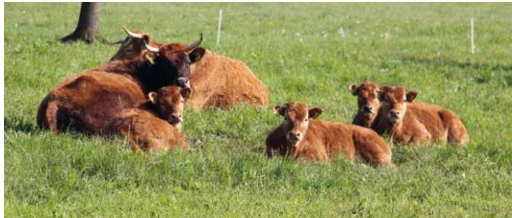
Bolezen modrikastega jezika se med živalmi širi s piki krvosesnih mušic, ki so najbolj aktivne v obdobju od aprila do decembra.

torjev se lahko živali za plemo ali proizvodnjo premaknejo tudi, če imajo pred premikom opravljene predpisane preiskave (virološke ali serološke preiskave krvi). Če gre za živali za zakol, je pogoj za premik odsotnost BT na izvornem gospodarstvu vsaj 30 dni pred premikom in v času aktivnosti vektorjev še tretiranje prevoznih sredstev z repelenti/insekticidi. Premiki vseh kategorij dovzetnih živali znotraj istega območja z omejitvami, kjer kroži isti serotip virusa, so dovoljeni, če na dan premika živali ne kažejo kliničnih znakov bolezni.