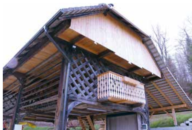
Na dvorišču dominira pred kratkim obnovljen kozolec toplar.

Kakorkoli, da ob nepredvidljivi službi, kar terenska veterinarska služba je, kmetija nor-