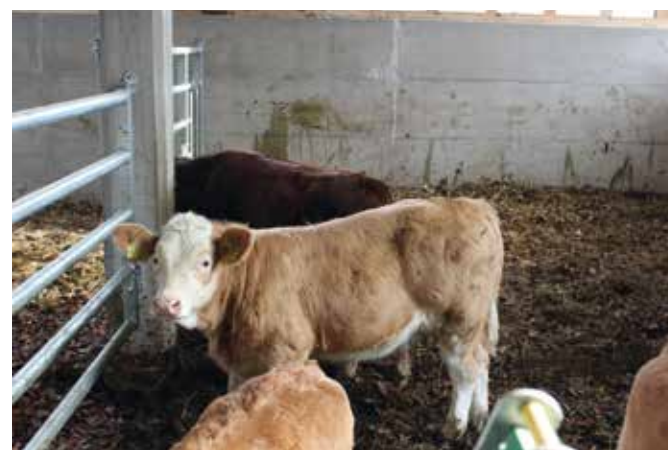
V novem objektu je za dobro počutje živali temeljito poskrbljeno.

Četudi smo govorili o pristočasnih aktivnostih, smo kaj hitro spet pristali v hlevu: