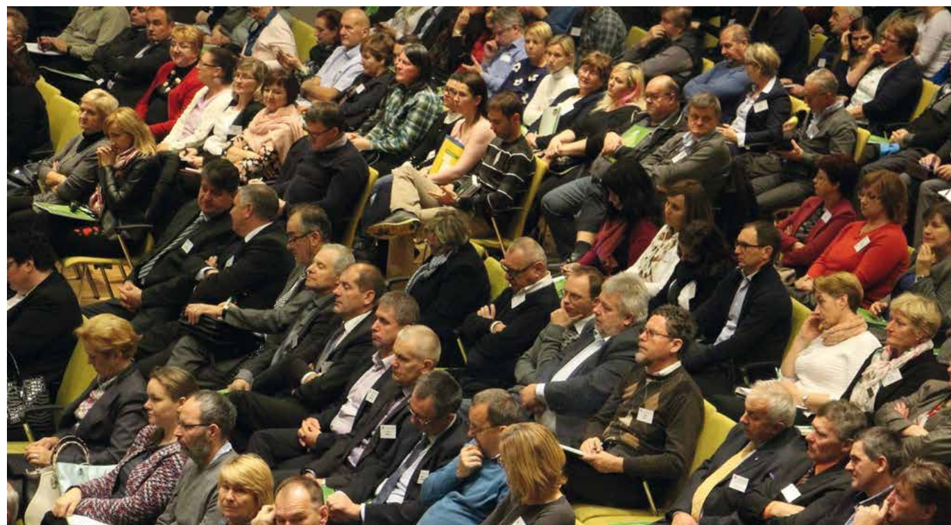
Kmetje potrebujejo celostni kmetijski nasvet, saj razvoj modernih tehnologij in digitalizacija zahtevata več kmetijskega svetovanja, kot ga je kmet kadarkoli doslej potreboval.

litični ravni tako za skupno lobiranje in lobiranje posameznih držav,« je povedal Zupančič in tudi: »Enotnost se pokaže pri zahtevi, da se sredstva za kmetijstvo ne smejo znižati. Dejstvo je, če želimo ohraniti kmetijstvo, rabimo več sredstev in hkrati najti način, kako pridelovati z dodano vrednostjo.« Pri tem je izpostavil nujnost zmanjševanja birokratskih zahtev ter ohranitev poseljenega podeželja in kmetijske panoge, ki ga politika rešuje z ukrepi mladi prevzemnik, ki pogosto prinaša problem medgeneracijskega sobivanja.