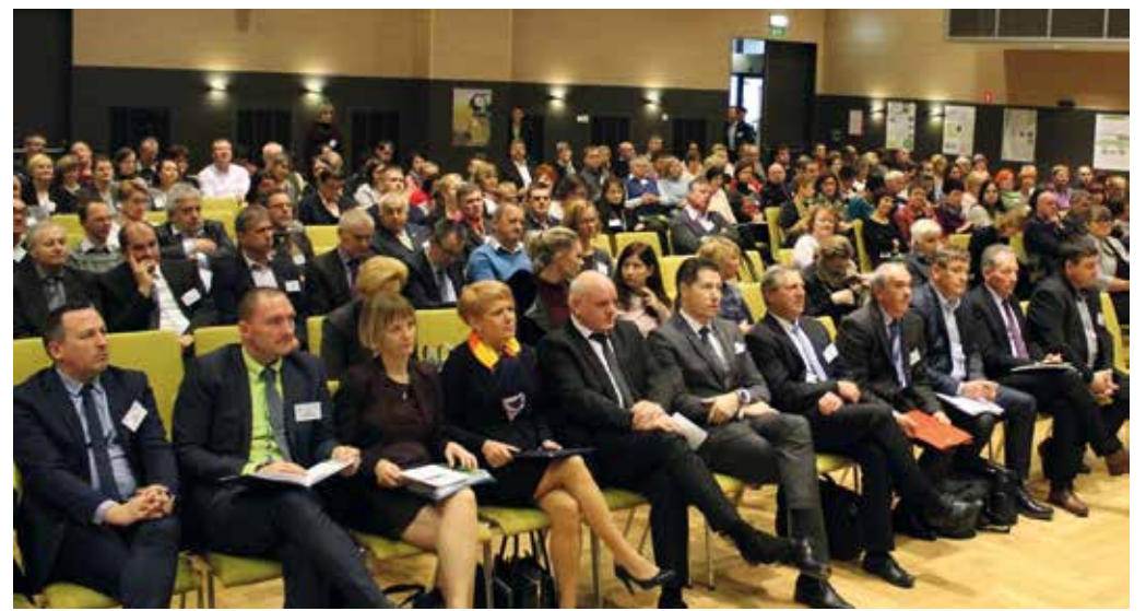
Na posvet vedno pridejo tudi pomembni gostje iz politike in stroke, tokrat je bila prvič v vlogi ministrice tudi dr. Aleksandra Pivec.