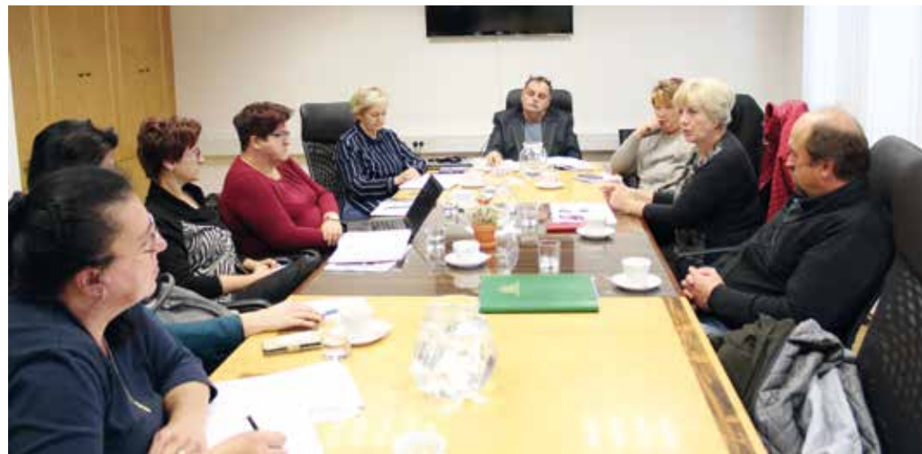
Odbor zelenjavne verige se je sredi novembra na izredni seji dogovarjal o možnostih odkupa viškov nekaterih vrst zelenjave. Nekateri pridelovalci namreč opozarjajo, da so naročila s strani trgovcev trenutno zelo majhna.

Sodelujoči so se pogovarjali tudi o raziskavah v kmetijstvu in varnosti ter kakovosti hrane.