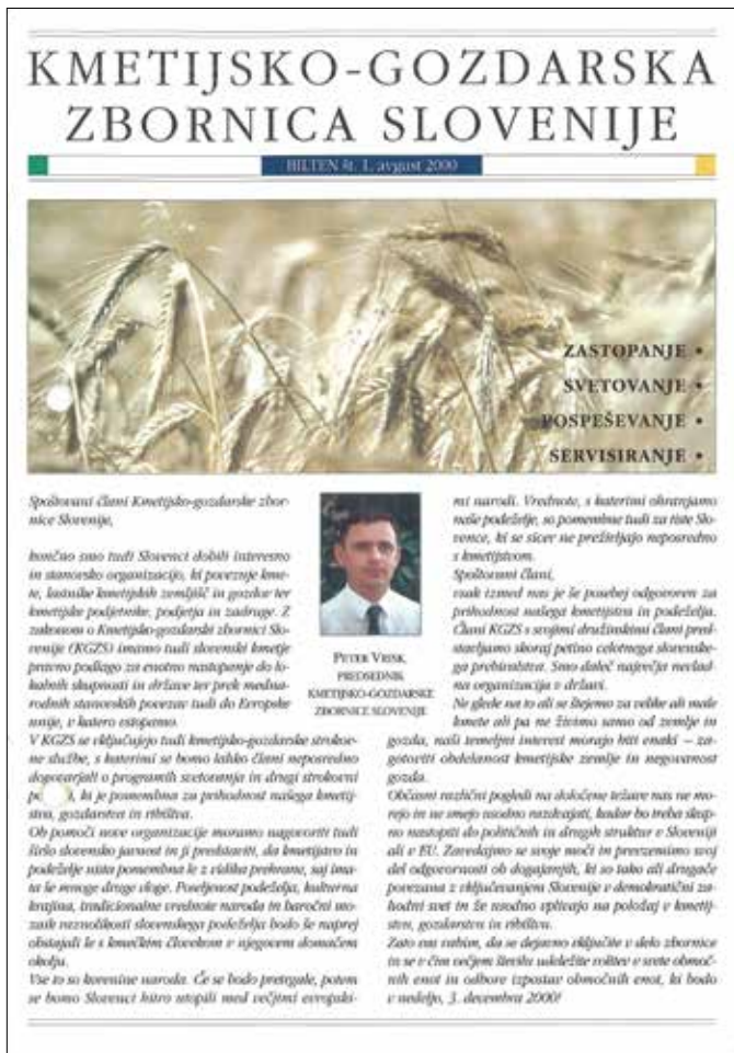
Štiri mesece po ustanovitvi so člani prejeli informativni bilten o nastanku in pomenu zbornice (levo).

V vsem tem času se poslanstvo Zelene dežele ne spreminja, in sicer obveščanje članov zbornice o njenem delovanju in posredovanje koristnih informacij. To bosta naš cilj in želja tudi v prihodnje. Veselo in pozorno branje vam želimo!