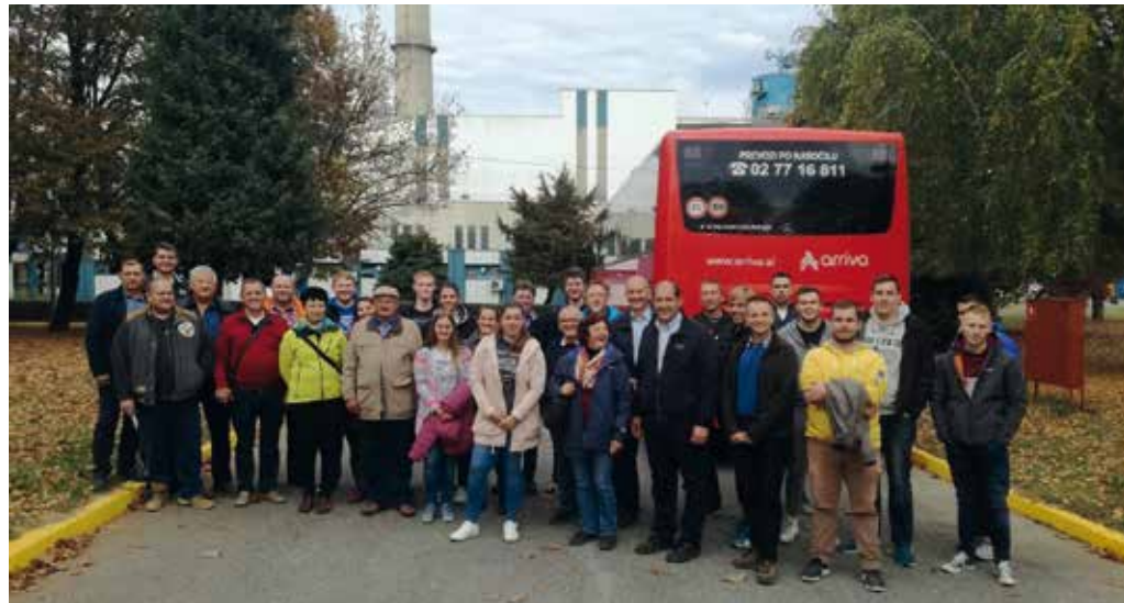
Udeleženci strokovne ekskurzije pred sladkorno tovarno Viro v Virovitiči

Namakalni sistem Kapinci – Vaška obsega površino 1260 ha. Minimalni delovni tlak v sistemu je 5,5 barov, dovodni cevovod iz reke Drave povezuje vodni vir z zbiralnikom, ki omogoča kontinuirano delovanje črpalk z instaliranim pretokom. Črpališče omogoča črpanje vode iz vodnega zbiralnika, dvig na potrebno višino, kar omogoča distribucijo vode po razvodnem tlačnem cevovodu do hidrantov na kmetijskih zemljiščih in priključitev ustrezne namakalne opreme. Vgrajene so štiri horizontalne črpalke s kapaciteto 200 l/s, z nazivnim tlakom 8,2 bara, moči 250 kW,