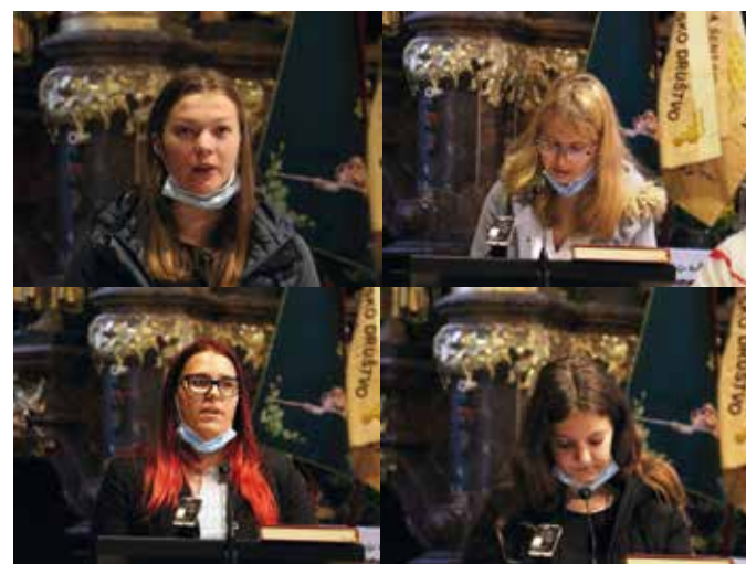
S prošnjami so sodelovale dijakinje Šolskega centra Šentjur.

bo lahko tudi najuspešnejše v dialogu z državo.« Kot nasvet mladim je izpostavil ustvarjalnost, ki jo omogoča delo na kmetiji. »Ne bojte se kmetovanja in prevzemanja kmetij! Nepomembno ni tudi zavedanje, da sodeluješ pri zagotavljanju nacionalne prehranske varnosti, ki omogoča preživetje naroda. Zaradi številnih vsesplošnih koristi so lahko kmetje ponosni in upravičeno samozavestni, saj s kmetovanjem aktivno sodelujejo pri oblikovanju pokrajine in Slovencev.«