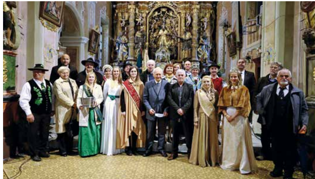
Sodelujoči pri sveti maši.

opredeljuje stiska pandemije, koliko delo kmeta velja v očeh sodržavljanov, ga še cenijo kot vrednoto ali pa je vprašanje pristne, domače hrane ob izobilju nenadzorovane, lahko dostopne hrane v vseh koncev sveta sploh še vprašanje, ki obremenjuje sodobnega človeka, se je v svojem razmišljanju spra-