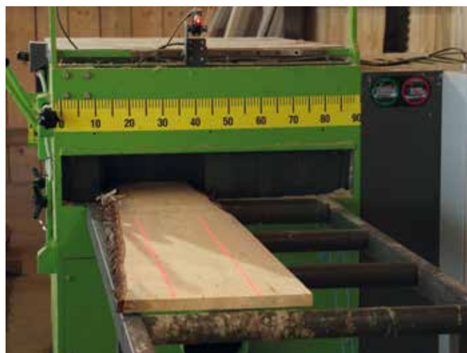
Z lasersko pomočjo je robljenje desk veliko lažje.

Obdelovalnih zemljišč je dvanajst hektarjev, prevladuje travinje. Pridelavo kornje so opustili, saj so bili pridelki skromni, pa še divjad in jazbeci so imeli »samopostrežno«. Zaradi nadmorske višine je prva košnja proti koncu maja