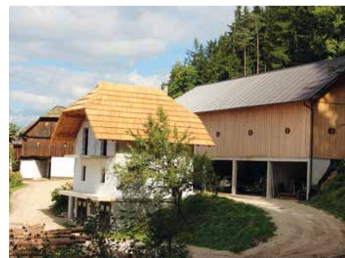
Podoba domačije Najevnik se spreminja. Desno je nova žaga, spredaj pa bo v nadgrajeni strojni lopi nastal bivalni prostor za novi rod.

Transport na kmetijo in s kmetije pa ostaja problem. »Nujno bi bilo, da bi imela občina Mežica več posluha za izboljšanje cestnih povezav. To je za nas zelo pomembno, še zlasti zaradi prevoza lesa, ki nam ga podjetje, s katerim sodelujemo, vozi s kamioni. Problem je spomladi, ko je odjuga in so ceste zmeščane. Ceste bi bilo treba bolj utrditi. Tako bomo mi lažje vztrajali v teh hribih, ki ostajajo obdelani zato, ker to delamo s srcem, a vendar potrebujemo tudi pogo-