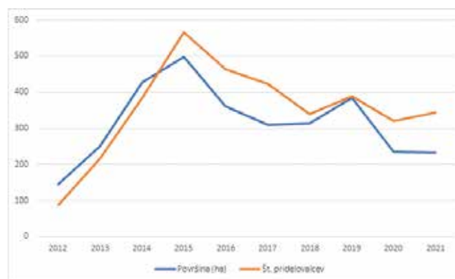
Število pridelovalcev konoplje in s konopljjo površina zasejana v desetih letih

sle niti trdoživi rastlini, kot je konoplja. Nekoliko kasnejše setve so se izkazale boljše kot zgodnje majske setve, vendar bi za optimalno pridelavo na večini površin potrebovali namakanje. Seveda se je kombinacija letošnjih vremenskih razmer različno odrazila tudi v odvisnosti od tipa tal in zaloznosti s humusom. Zaradi