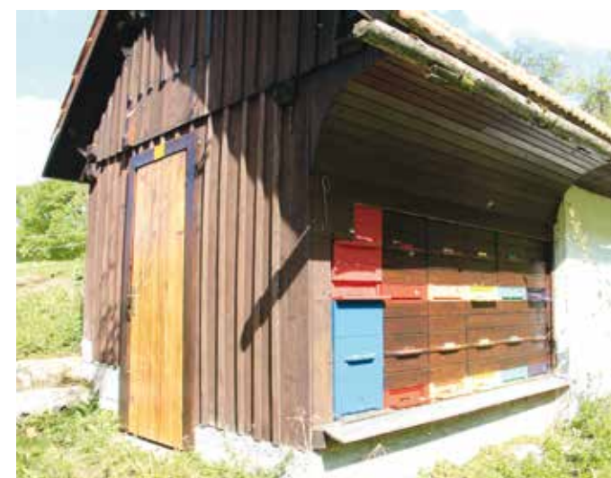
Kot se spodobi za koroško kmetijo, je na njej tudi čebelnjak.

je, da bomo ohranjali poseljeno in obdelano podeželje,« zaključil mladi prevzemnik Najevnikove domačije.