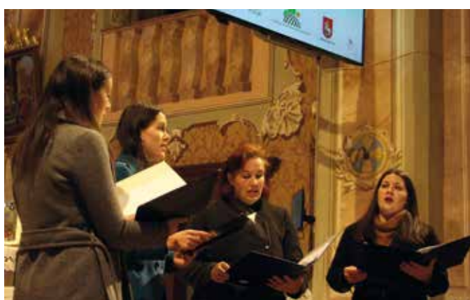
S petjem je obogatil dogodek kvartet družine Štiglic.

Dogodek je organizirala Kmetijsko gozdarska zbornica Slovenije v sodelovanju z občino Šentjur, župnijo Ponikva in številnimi prostovoljci.