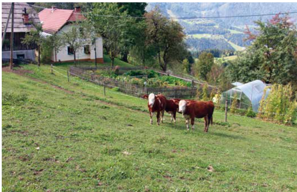
S pašo vzdržujejo obdelane strmine Karavank.