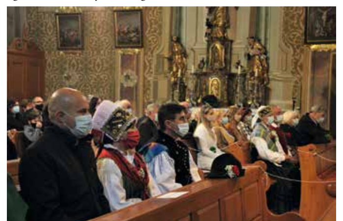
Svečani pridih dogodku sta dala para v narodnih nošah.

naša suverenost. V Sloveniji je velik del rodovitne zemlje na neugodnih terenih, kjer ni mogoče