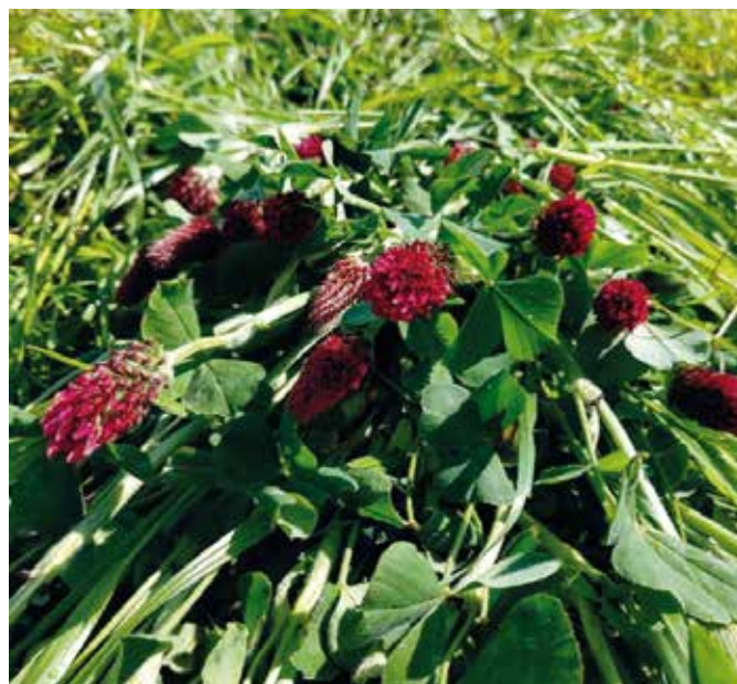
Posevek mnogocvetne ljujke in inkarnatke na eni izmed partnerskih kmetij

Preizkušali smo mešanico inkarnatke ( Trifolium incarnatum ) in črne detelje ( Trifolium pratense ) (27,5 kg/ha), mešanico obeh detelj in mnogocvetne ljujke ( Lolium multiflorum ) (33,75 kg/ha) ter mnogocvetno ljujko ( Lolium multiflorum ) v čisti setvi (40 kg/ha). Pridelovali smo torej deteljo v čisti setvi (mešanica dveh detelj), mešanico detelj in ljujke z visokim deležem detelj in ljujko v čisti setvi. Setev po strnišču in klasični obdelavi tal smo izvedli v zadnjih dneh avgusta in prvih dneh septembra glede na pogoje na kmetijskem gospodarstvu. Ob setvi smo opravili tudi gnojenje glede na analizo tal, v povprečju smo upora-