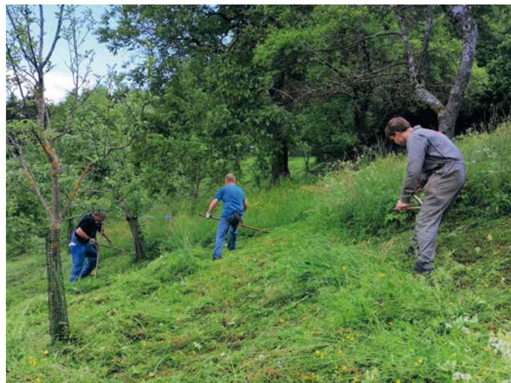
Ročna košnja je še vedno del letnih opravil na kmetiji.