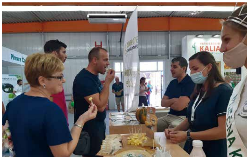
Projekt Seneno meso in mleko smo uspešno predstavili tudi na sejmu Agra v Gornji Radgoni