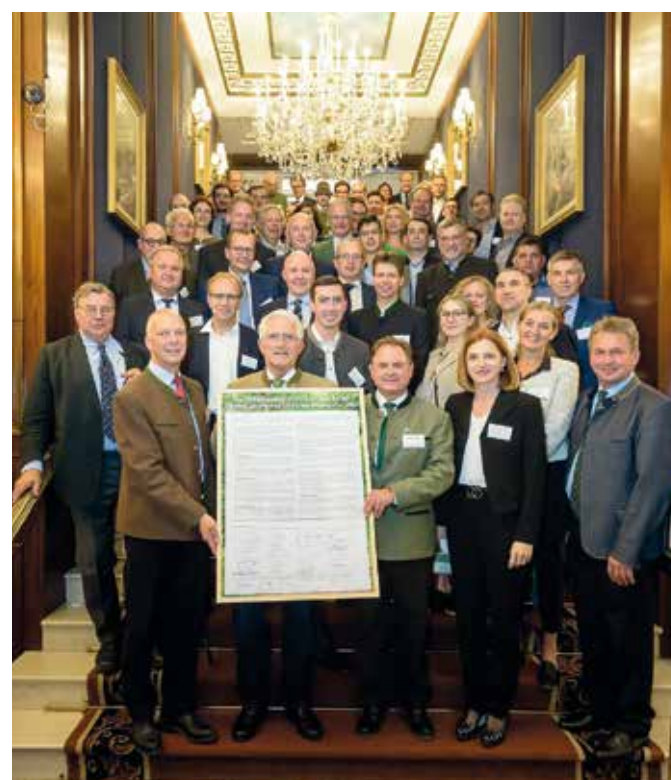
Predstavniki lastnikov iz šestnajstih držav in vseh krovnih organizacij so sopodpisniki Dunajske deklaracije.

Gozdarstvo je v EU edini sektor, ki ne pripomore k podnebnim spremembam in zagotavlja ponor CO 2 , ki prihaja iz ostalih sektorjev. Les nadomesti beton, kovine in plastiko ter skladišči CO 2 v izdelkih in stavbah. Usmeritve nove gozdarske strategije so nevarne tudi glede varstva in ohranjanja gozdov. Negospodarjeni gozdovi so ob podnebnih spremembah veliko bolj nestabilni in pod-