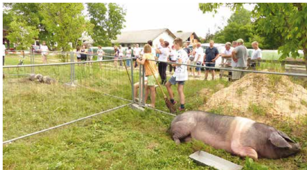
Predstavitev pasme in projektov na kmetiji Ložar v Leskovcu pri Krškem

kovosti mesa pri pasmi krškopoljski prašič. Rezultati, pridobljeni v projektu, ki je financiran iz Programa razvoja pode-