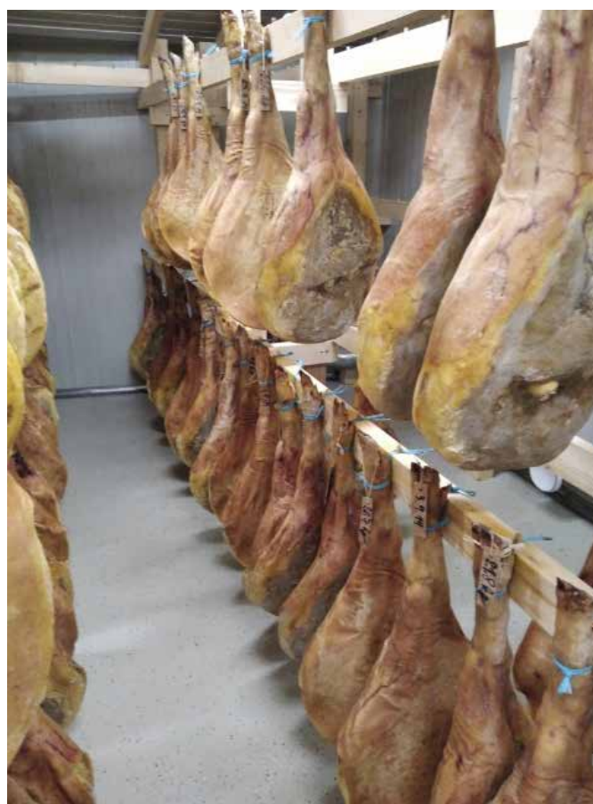
Sušenje pršutov na kmetiji Cigoj

V Vipolžah smo obiskali vinsko klet Edija Simiča. Na kmetiji se prepletata dejavnosti vinogradništva in vinarstva